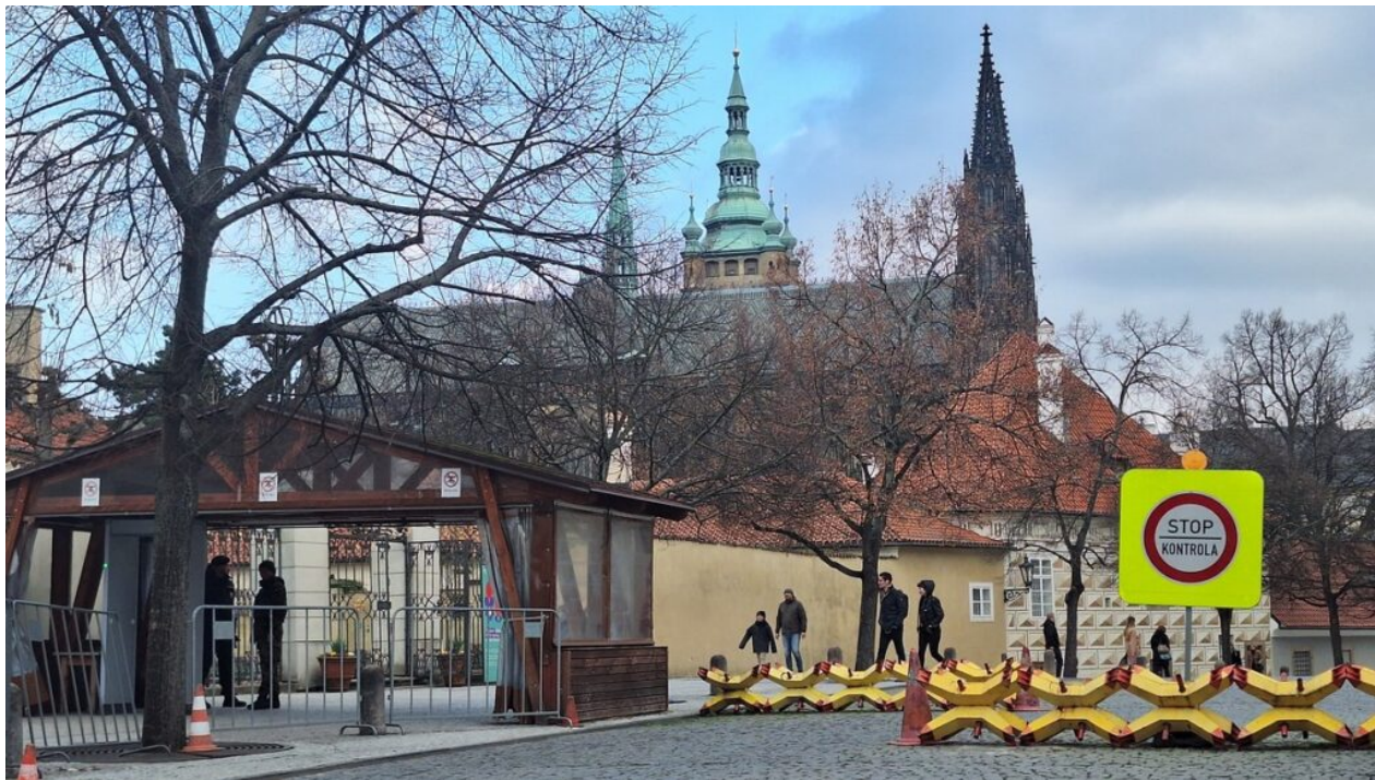
Pražský hrad, 8. března 2023

Bývalý prezident Miloš Zeman si Pražský hrad uzmul pro sebe a svoje vazaly, aby si zde pořádali soukromé oslavy narozenin. To jediné, co zde vybudoval, byly osvětlimanské jarmareční dřevěné přístřešky, aby nepršelo na policisty provádějící „filcung“.