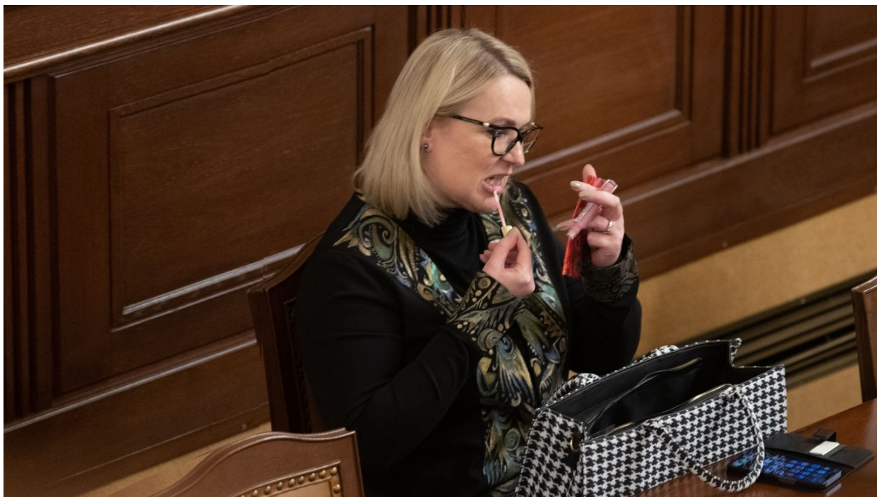
Jana Černochová, ministryně obrany na 50. schůzi Poslanecké sněmovny

V rámci objektivitu opět dodejme, že docházka Jany Černochové do parlamentu není katastrofální, když uvážíme, že je zároveň členkou vlády a ještě radní pro oblast školství a mládež na Praze 2. Přitom nejde o funkci, která by Černochové jaksi zbyla z minulých dob, kdy ještě ministryní nebyla. Už jako ministryně kandidovala Černochová v komunálních volbách na podzim roku 2022 do zastupitelstva Prahy 2 z 2. místa kandidátky subjektu „ODS a TOP 09 – SPOLEČNĚ PRO Prahu 2“. Dne 17. října 2022 se pak nechala zvolit radní městské části.