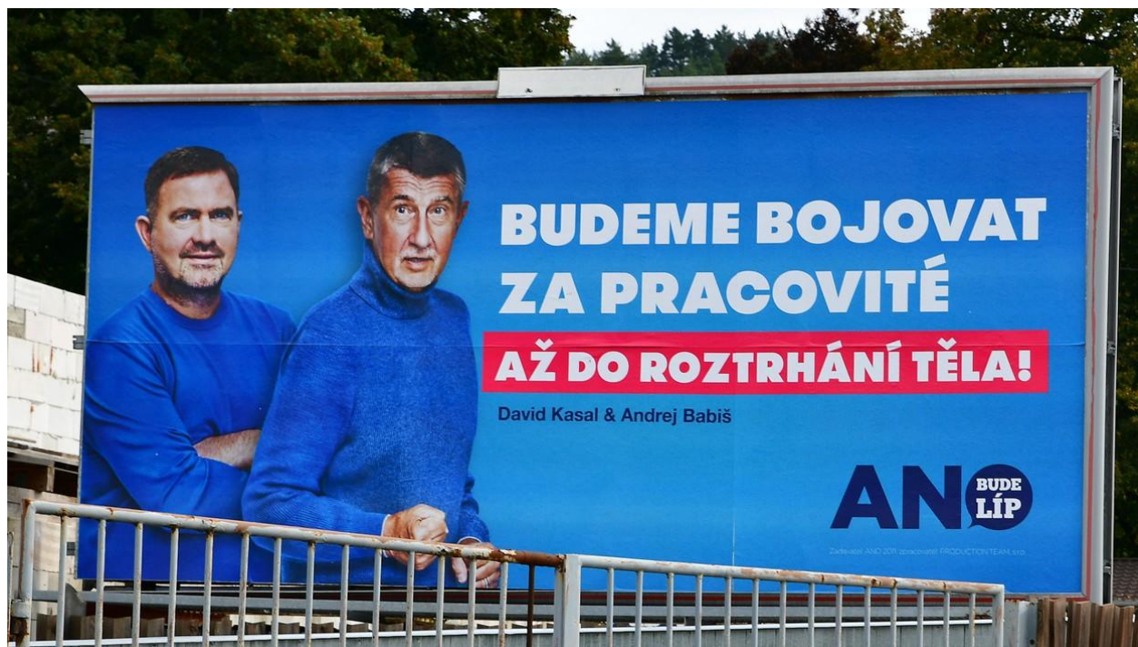
Volby 2021, volební billboard, ANO, Andrej Babiš, David Kasal.

Přestože Kasal absentuje na více než polovině jednání dolní komory, nechal se zvolit členem volební komise, do výboru pro zdravotnictví, členem podvýboru pro elektronizaci ve zdravotnictví a evropskou zdravotní legislativu, členem podvýboru pro elektronizaci ve zdravotnictví a evropskou zdravotní legislativu, členem podvýboru pro oblast specializačního a profesního vzdělávání, vědu a výzkum, členem podvýboru pro veřejné zdravotnictví, epidemiologii a prevenci a předsedou podvýboru pro lékovou politiku, přístrojovou techniku a zdravotnické prostředky. Říkáte si možná, k čemu tolik výborů a podvýborů, ale o tom až později.