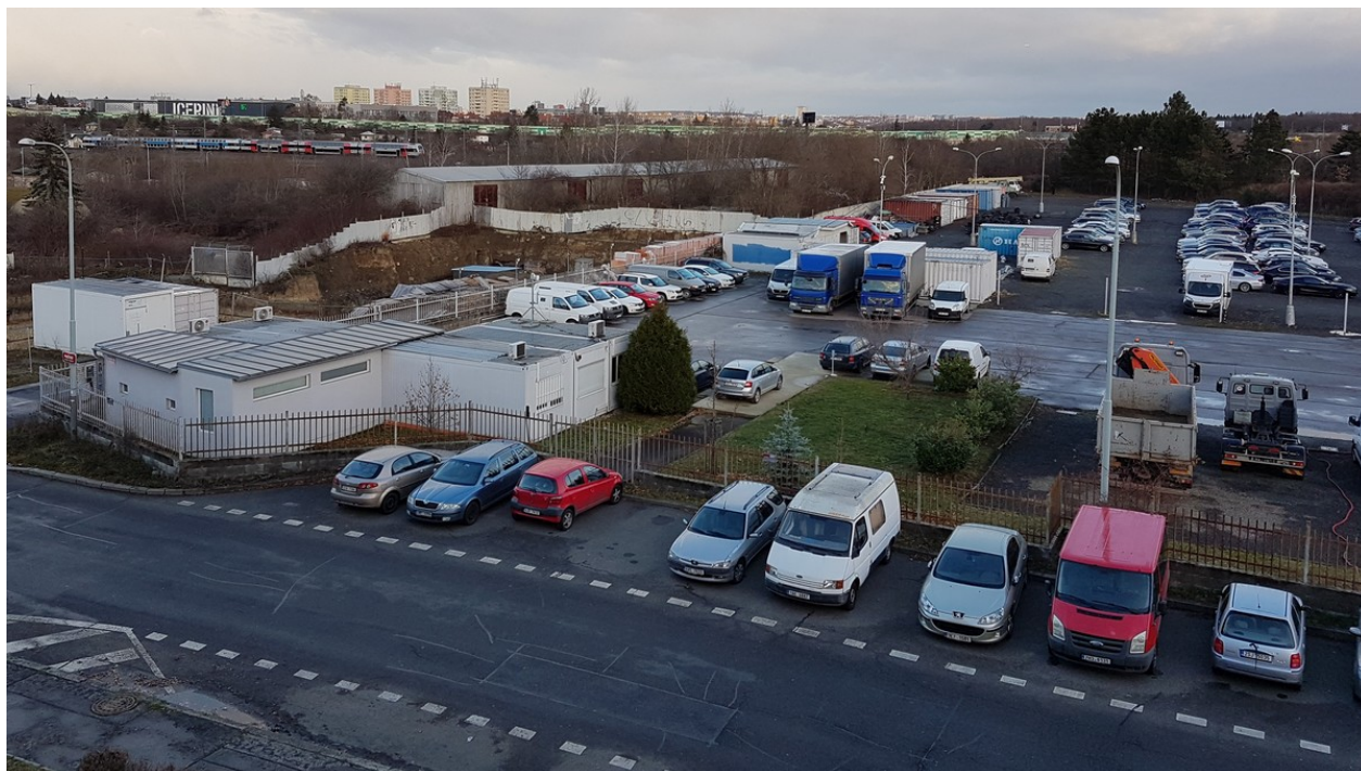
Autobazar v Pražské ulici v Praze 15 | prosinec 2023

nízká pokuta 10 tisíc korun. Tato pokuta byla uložena teprve po Kverulantových opakovaných urgencích a dotazech proč autobazar ještě stojí.