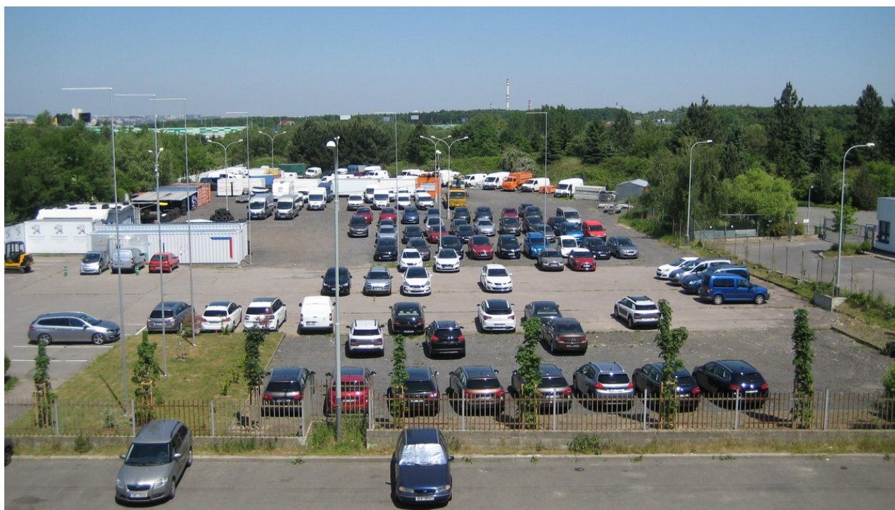
Celkový pohled na autobazar 6. června 2015