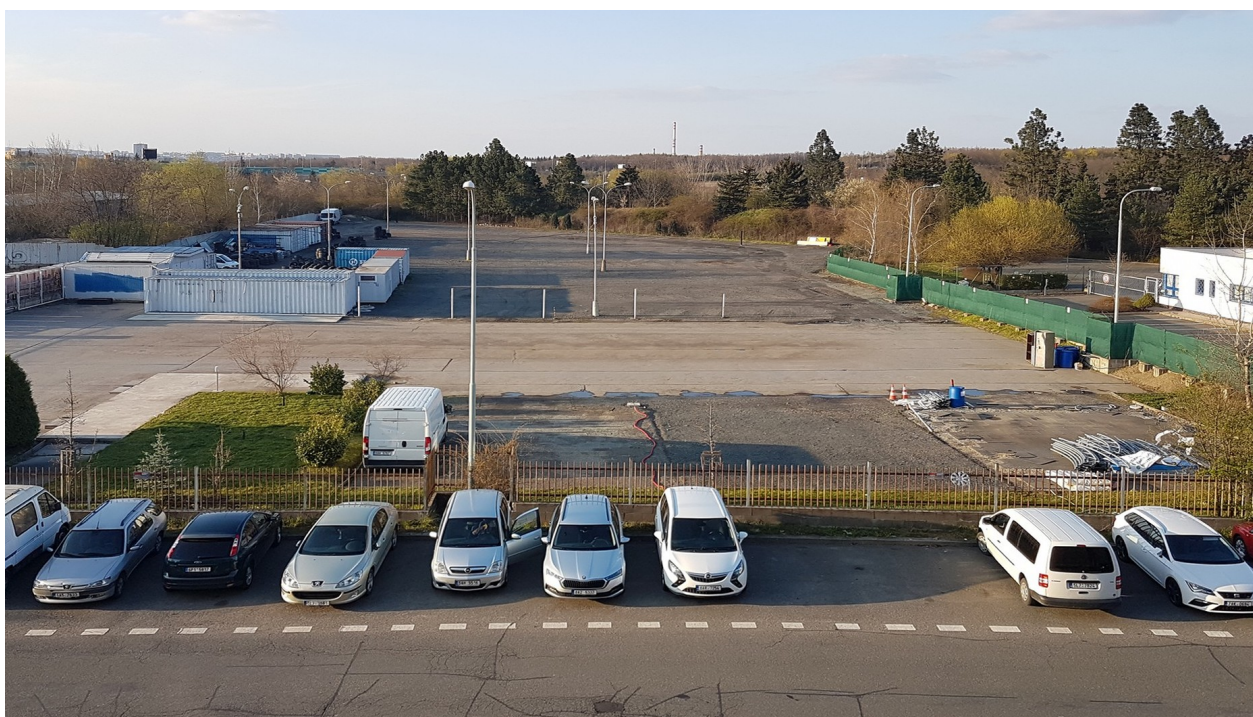
Autobazar na Praze 15 | 10. duben 2023

Velký mediální zájem, který Kverulant rozpoutal, a usedavé volání po nápravě nakonec přineslo své ovoce. Pravděpodobně také velmi pomohlo, že se o ničemném chování české pobočky dozvěděla švýcarská centrála. Emil Frey počátkem dubna 2023 autobazar konečně vyklidil.