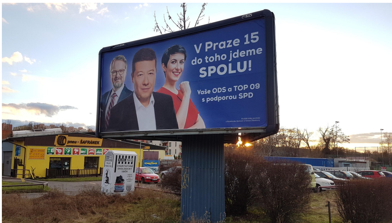
Praha 15, leden 2023

V prosinci 2023 se poslanec Milan Wenzl zvolil čestným občanem Prahy 15. Hlasovala pro něj nejtěsnější potřebná většina a rozhodující hlas pro své vlastní ocenění dodal sám bývalý starosta a nynější zastupitel Wenzl.