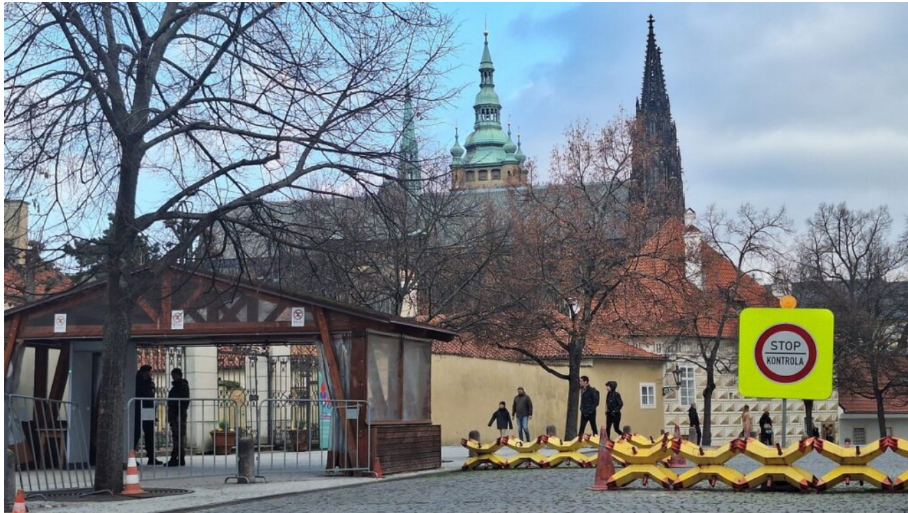
Pražský hrad, 8. březen 2023

Bývalý prezident Miloš Zeman si Pražský hrad uzmul pro sebe a svoje vazaly, aby si zde pořádali soukromé oslavy narozenin. To jediné, co zde vybudoval, byly osvětimanské jarmareční dřevěné přístřešky, aby nepršelo na policisty provádějící „filcung“.