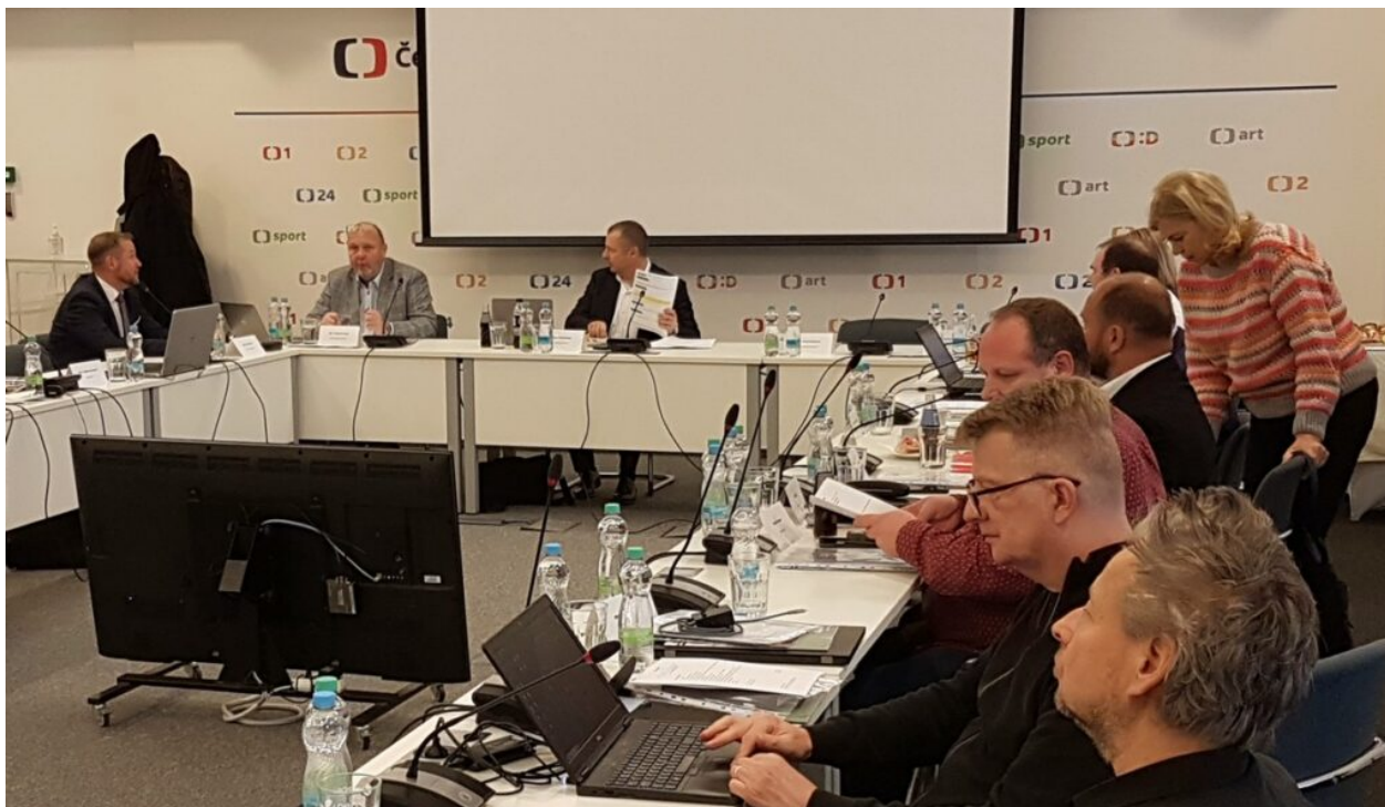
Jednání rady České televize dne 13. prosince 2023