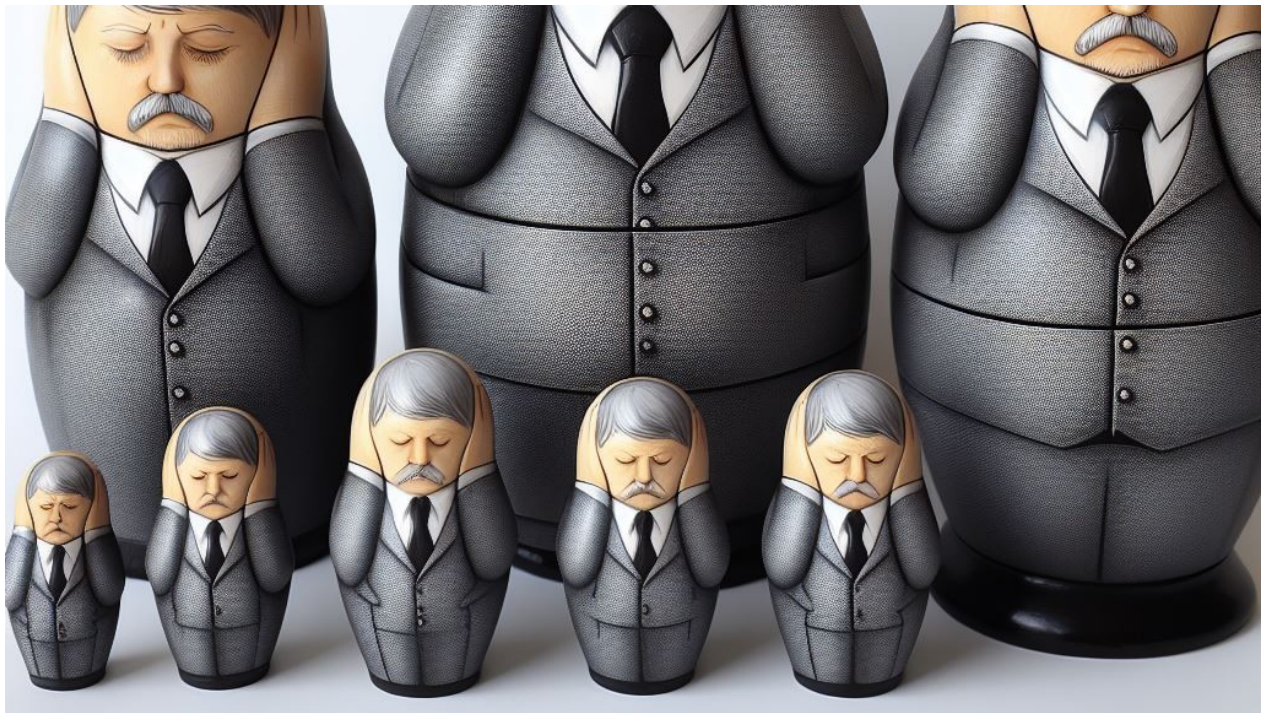
Ilustrační koláž vytvořená Kverulantem za pomoci AI Bing images create, který používá technologii DALL·E 3