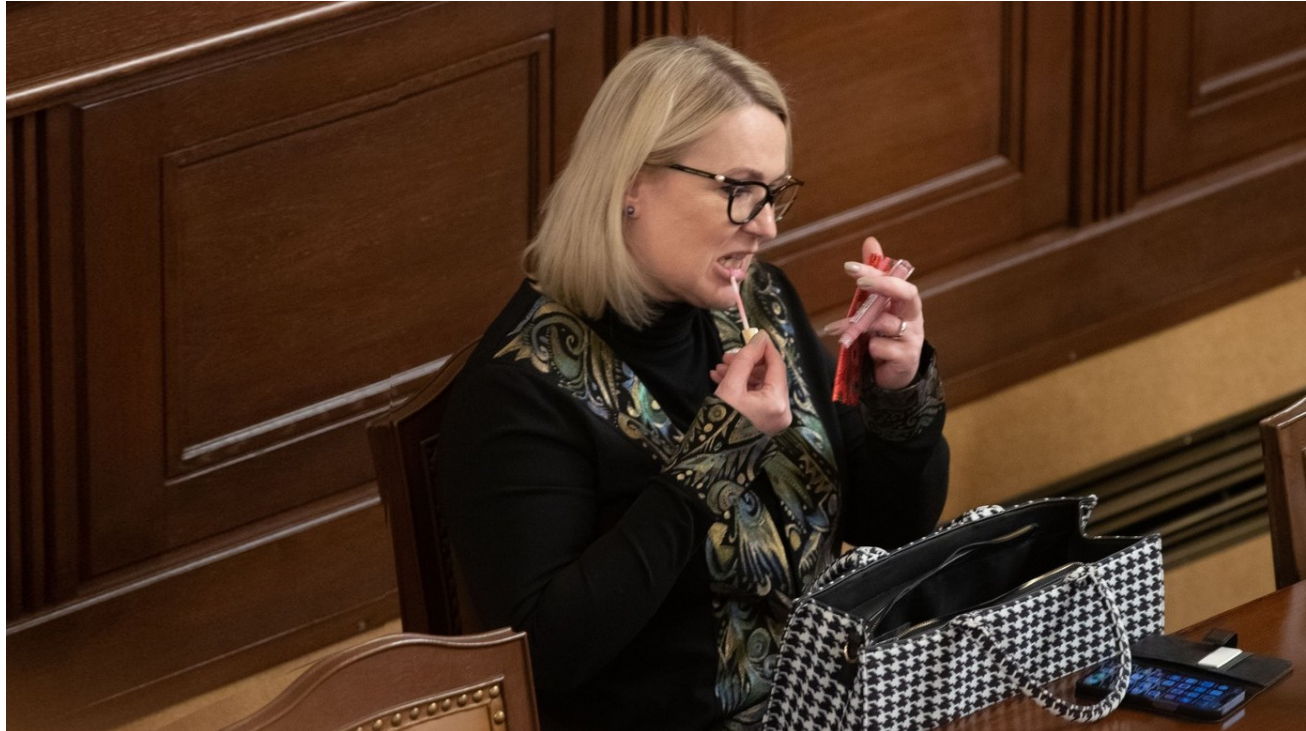
Jana Černochová, ministryně obrany na 50. schůzi Poslanecké sněmovny

I Jana Černochová (ODS) patří k týmu předsedy Petra Fialy (ODS). Na jednání dolní komory parlamentu byla přítomna jen v 92 případech ze všech 156 jednacích dnů. To je účast 59 %. I přesto Černochová za svoji „práci“ ve sněmovně pobírala plat přes 100 tisíc korun měsíčně a čerpala náhrady ve výši přes 44 tisíc korun měsíčně. Vedle toho pobírá Černochová ještě plat ministryně obrany ve výši téměř 175 tisíc hrubého měsíčně.