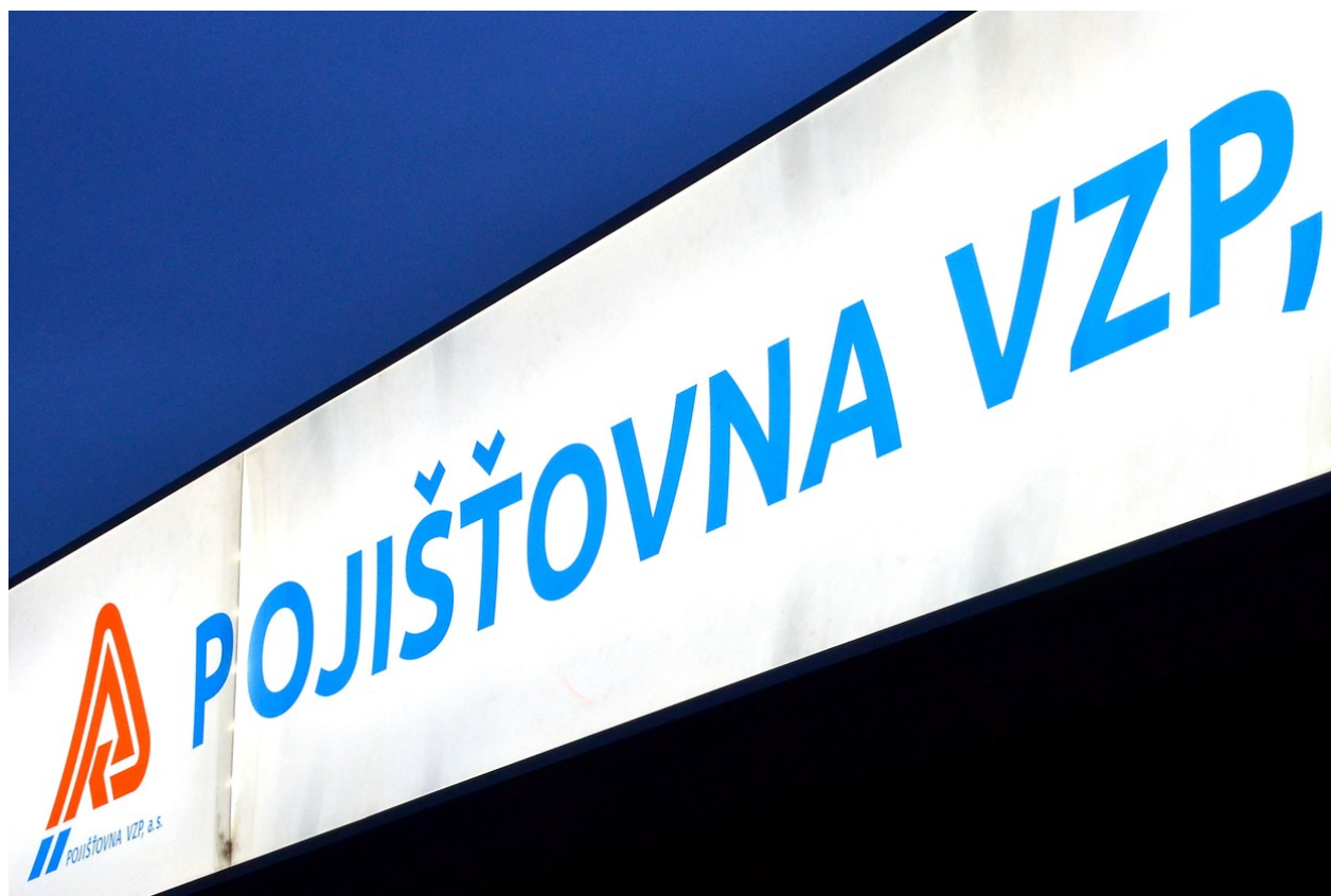
Pojišťovna VZP

Nicméně obecně platí, že předseda správní rady VZP inkasuje každý měsíc 15 tisíc korun. Když se zúčastní jednání, dostane navíc 20 tisíc. Správní rada zasedá obvykle jednou za měsíc. Předseda tak měsíčně dostane 35 tisíc korun. Odměna pro místopředsedu, tedy pro Kalouska, činí maximálně 27 500 korun. Měsíční paušál dělá 12 500 korun a navíc inkasuje 15 tisíc korun, když přijde na zasedání správní rady. Řekněme, že takové zasedání správní rady trvá 8 hodin. Kalousek si tak za těchto osm hodin přijde skoro na třicet tisíc korun. Pokud by Kalousek dostával podobné peníze i za zasedání v dceřiné PVZP, mohl by si měsíčně přijít na šedesát tisíc korun.