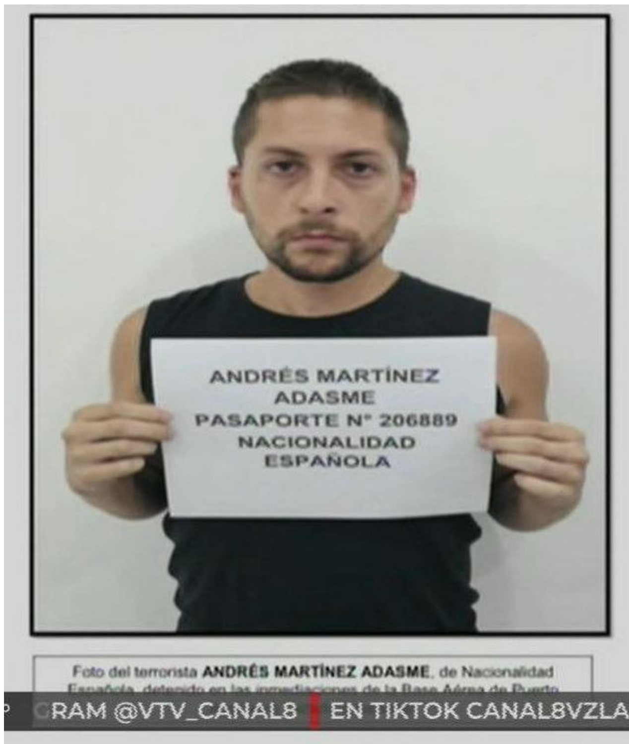
Fotografie z venezuelské televize