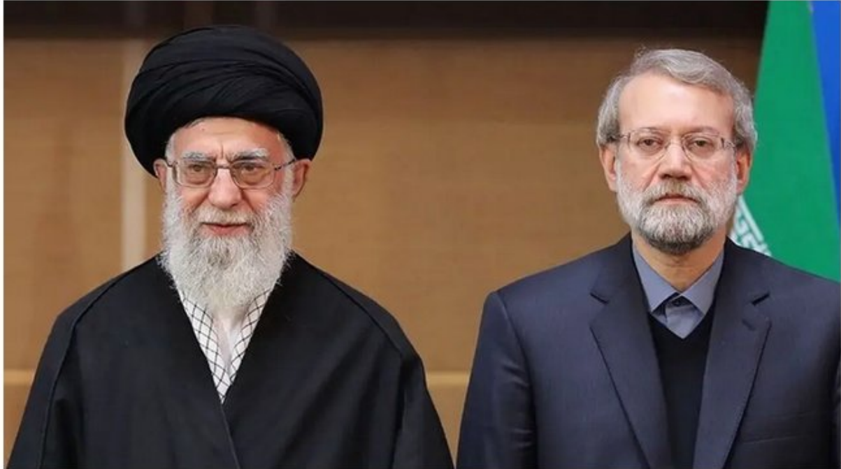
Iran's Supreme Leader Ali Khamenei and his advisor Ali Larijani

Iranian authorities are preparing to respond to Israel's October 26 attack on the Islamic Republic's military sites, an advisor to Iran's Supreme Leader Ali Khamenei said on Sunday.