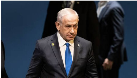
Israel ready to implement Lebanon ceasefire - Netanyahu

More than 60 people have been killed in Israel by Hezbollah attacks and more than 3,500 people have been killed by Israeli airstrikes on Lebanon since October 2023, according to officials from both sides. Some 70,000 people in Israel and around 1.2 million people in Lebanon have been displaced.