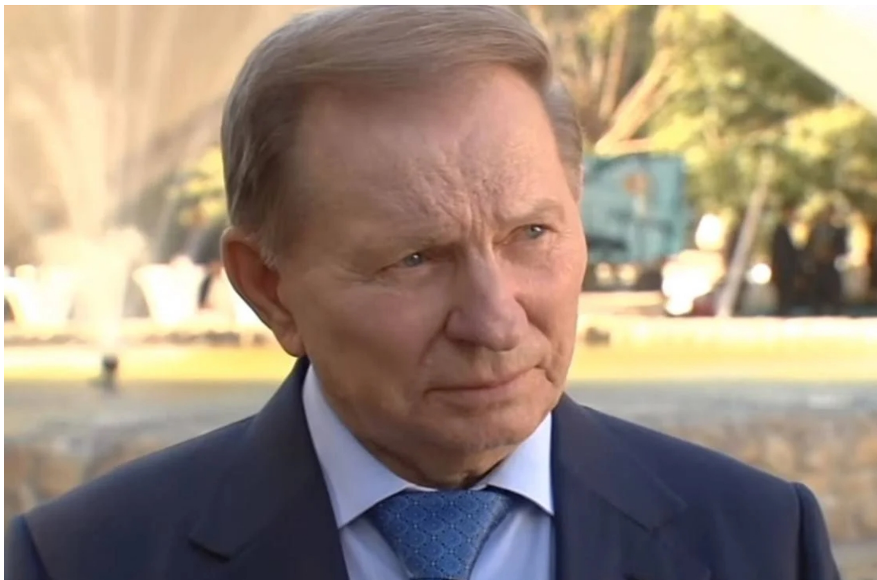
Leonid Kučma, bývalý ukrajinský prezident

Ruskojazyčné regiony na Ukrajině v době SSSR nepředstavovaly problém, protože v té době byla Ukrajina součástí jednoho státního svazku, takže etnická majorita regionů na Ukrajině nehrála roli. To se ale změnilo po roce 1991, kdy se ruské obyvatelstvo a ruské regiony na Ukrajině dostali do samostatného ukrajinského státu, který začal ovládat banderismus, šovinistická a nacionální hnutí s extrémní vyhraněností proti Rusům na východě Ukrajiny a proti Poláků na západě v prostoru Haliče. Jediným štěstím byli ukrajinští prezidenti sovětského formátu, kteří tlumili a dusili tato hnutí s cílem nerozpoutat rozpad a rozvrat Ukrajiny v občanské válce.