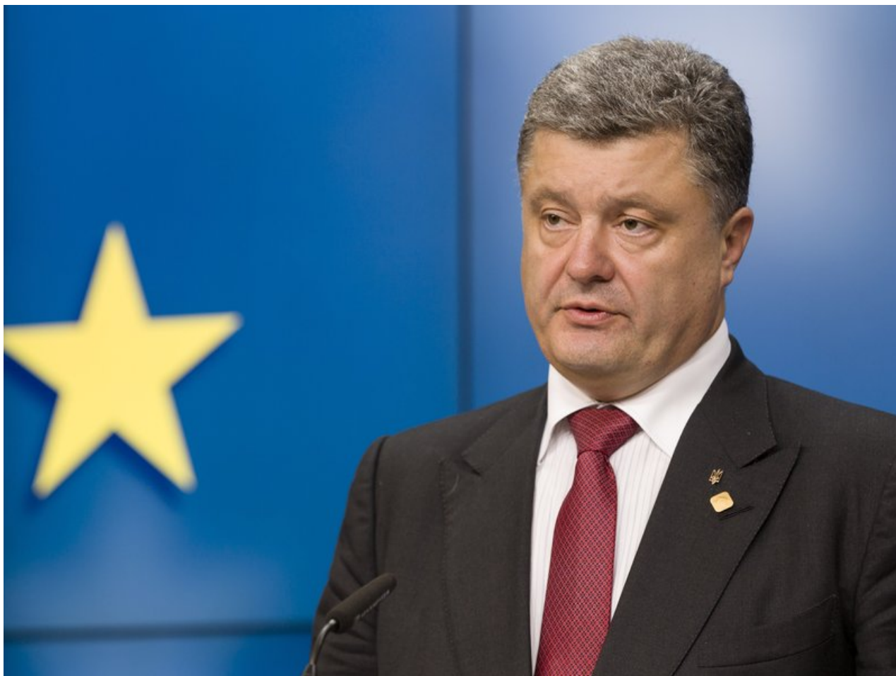
Petro Porošenko, bývalý prezident post-majdanovské Ukrajiny

Jak uvedl [2] deník The New York Times v rozhovoru s Pavlem, prezident České republiky je bývalý vysoký generál NATO, který byl jedním z nejpevnějších zastánců Ukrajiny ve válce s Ruskem, ale teď říká, že je podle něj čas, aby se Ukrajinci a jejich příznivci postavili čelem k tomu, co je podle něj realita.