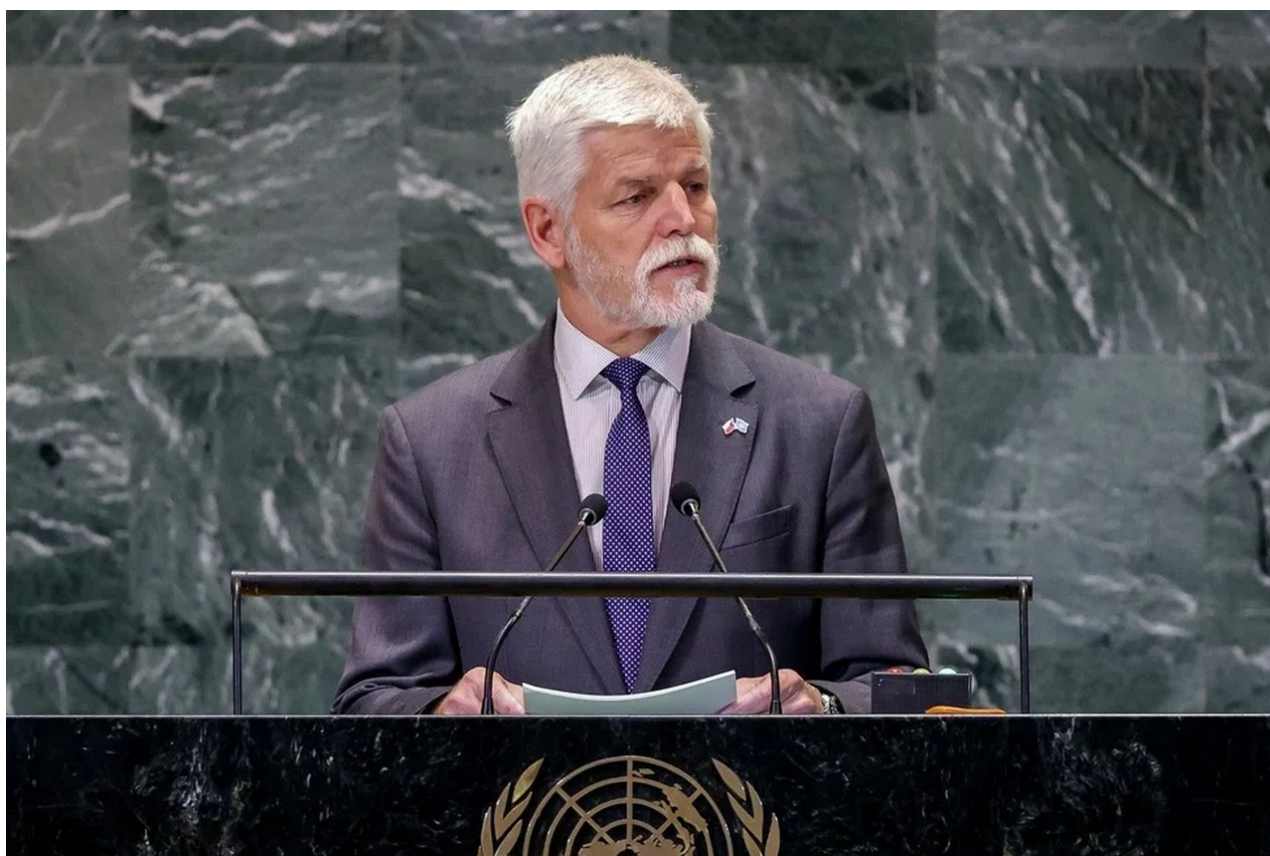
Petr Pavel s projevem na Valném shromáždění OSN

Rozhovor s Pavlem proběhl na okraj výročního Valného shromáždění OSN a Pavlovy výroky prostě znovu vrací na tapetu tzv. přípravné tance na střet s realitou po návratu Donalda Trumpa do Bílého domu. Pavel tyto výroky ze sebe nevypouští jako civilista, ale jako kariévní voják, který se stále řídí rozkazy ze shora, ze zákulisí, z nadřízených instancí v NATO a ve Washingtonu. A v rozhovoru pro americký deník to zdaleka není všechno.