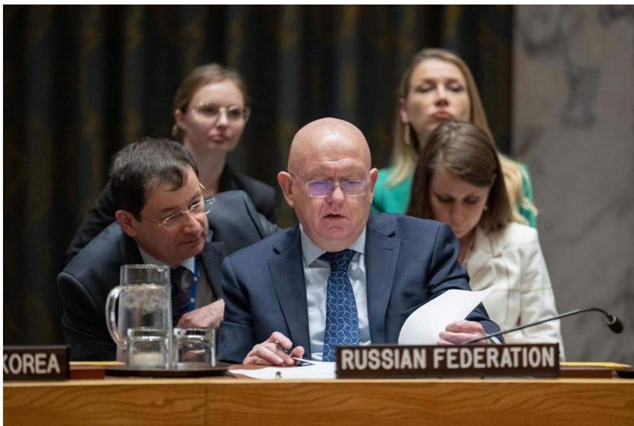
Ruský velvyslanec v OSN Vasilij Nebenzja

Je to neuvěřitelné, ale výše citované výroky Petra Pavla jsou doslova snad jako okopírované z mých článků tady na Aeronetu. Kolikrát jsem tady psal, že válka na Ukrajině z pohledu západu je konceptem, jak úplně vyhladit ukrajinskou populaci, která slouží jako maso do ruského velkokapacitního masomlýna? Píšu o tom už pomalu 2,5 roku, ale teď najednou to čtu a slyším od Petra Pavla.