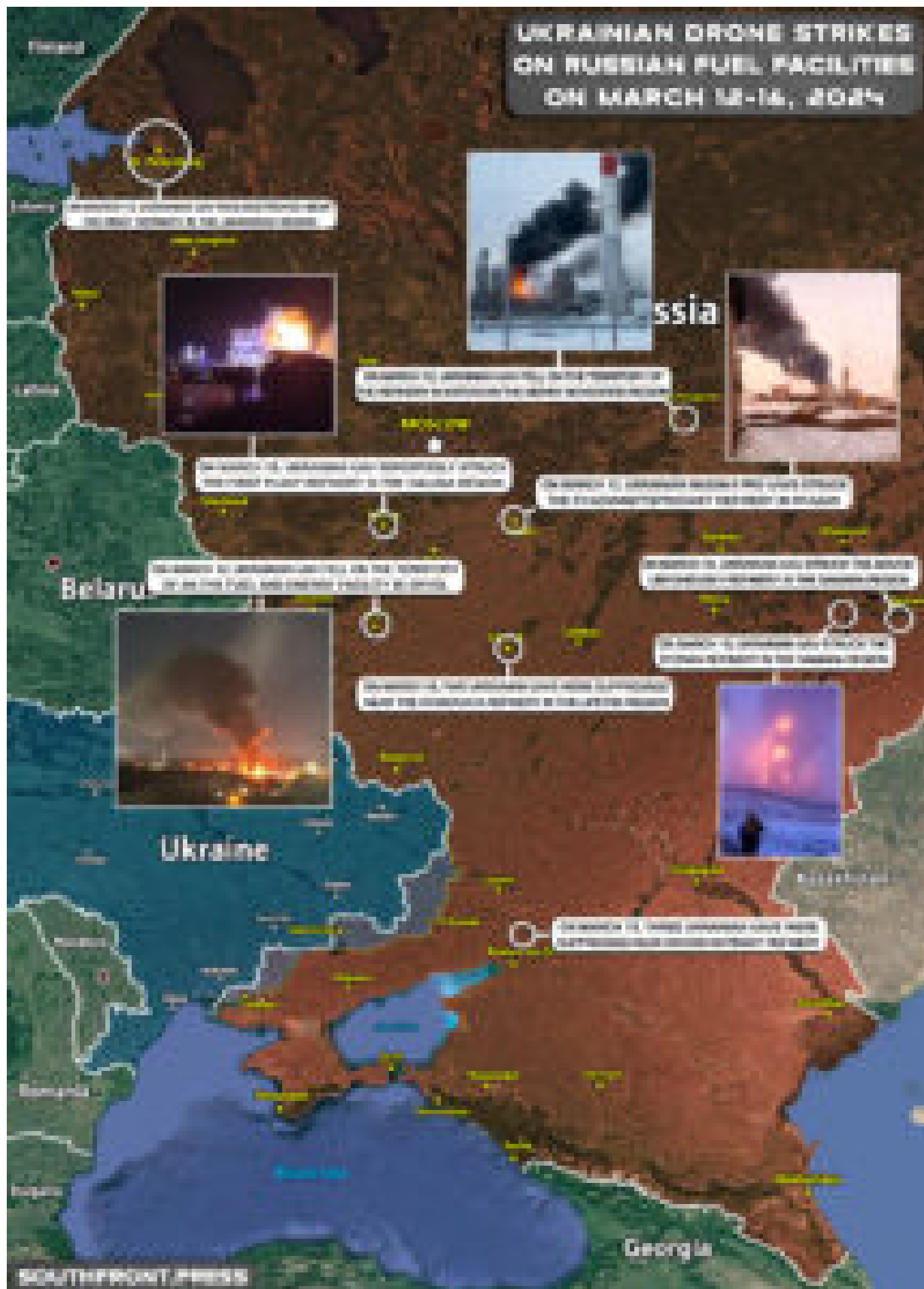
Kliknutím zobrazíte obrázek v plné velikosti

Britská strana údajně přispěla velkým úsilím k zahájení a organizaci této kampaně. Lze ji tedy právem považovat za britskou operaci zabalenou do ukrajinské vlajky. Zprávy říkají, že někteří vysoce postavení zástupci britských speciálních služeb jsou přímo zapojeni do plánování a provedení této operace v Kyjevě.