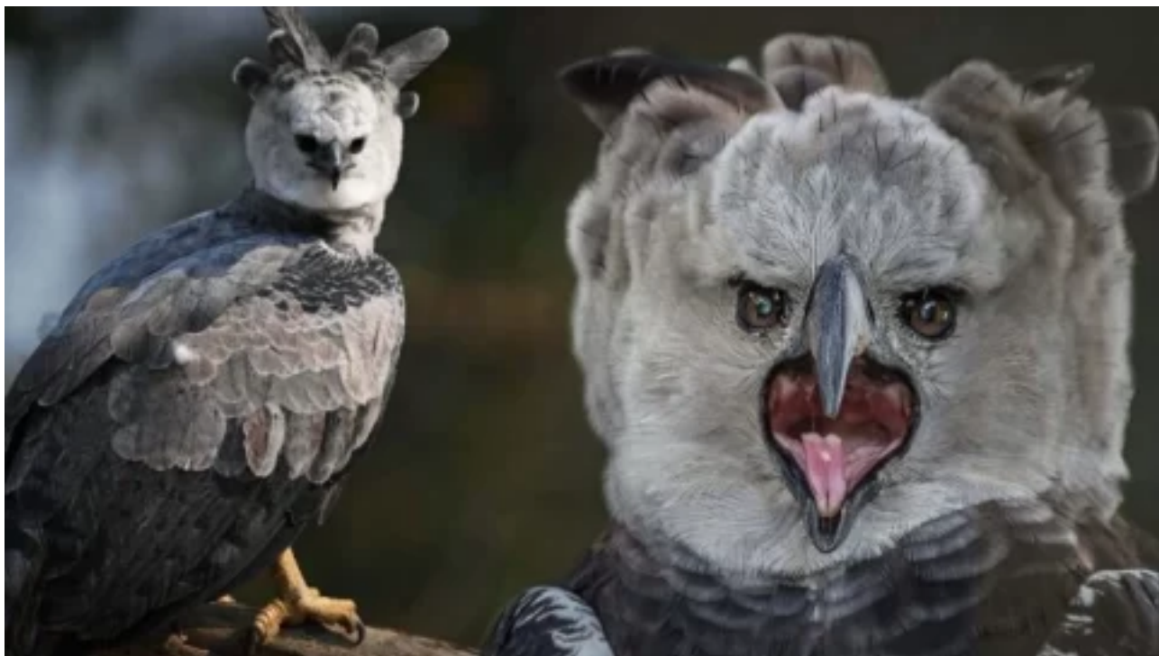
Obří dravec: Nejsilnější orel světa s drápy většími, než má grizzly.