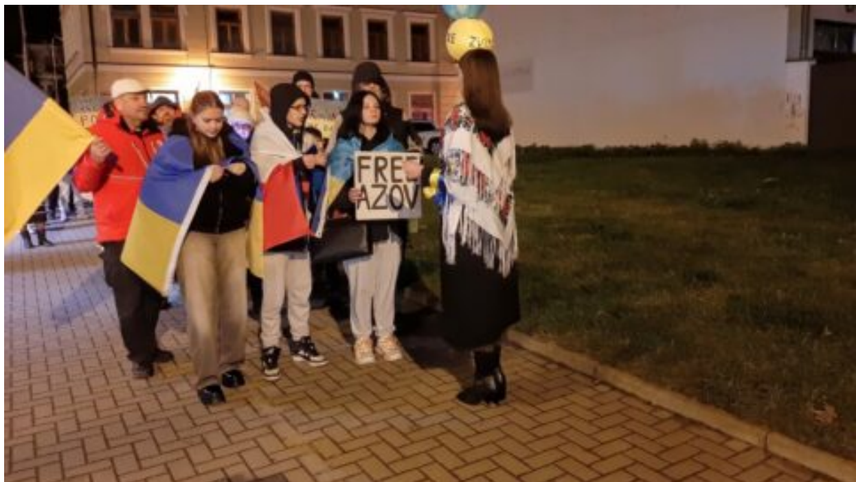
Tichý průvod ulicemi Jihlavy: Věříme, že světlo zvítězí nad temnotou