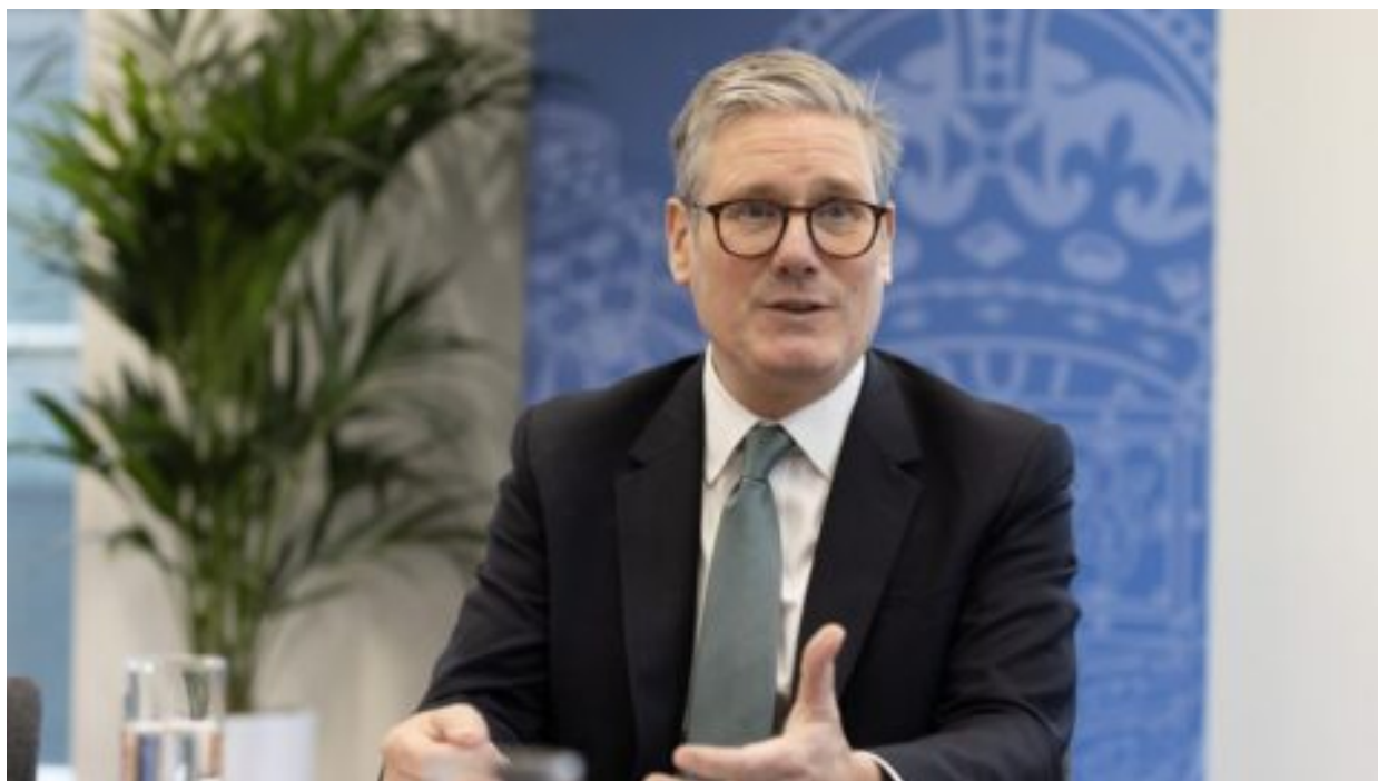
Od úletů fantazie k protestům: Pád britského premiéra Keira Starmera