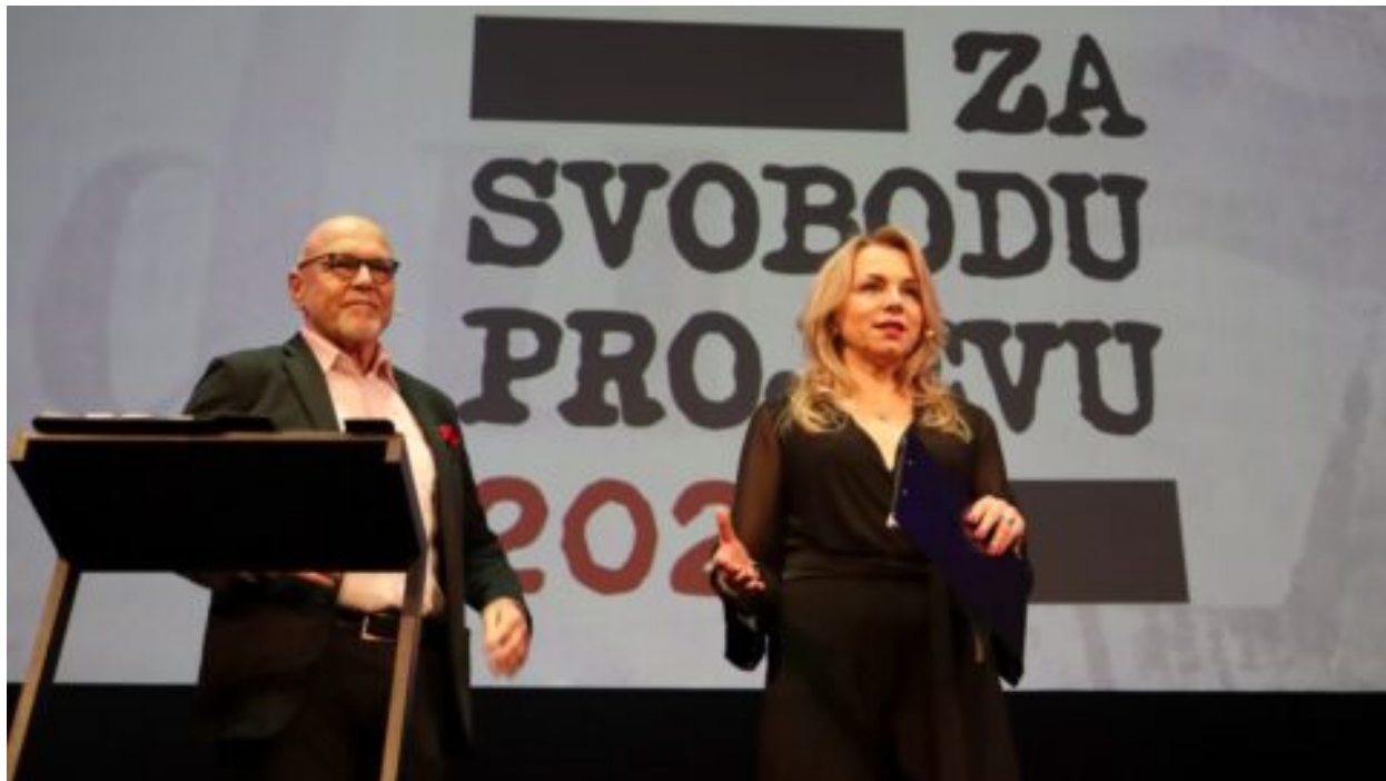
„Cena za normálnost.“ Kdo získal první ceny za svobodu projevu a proč má anticenu Calverova banda?