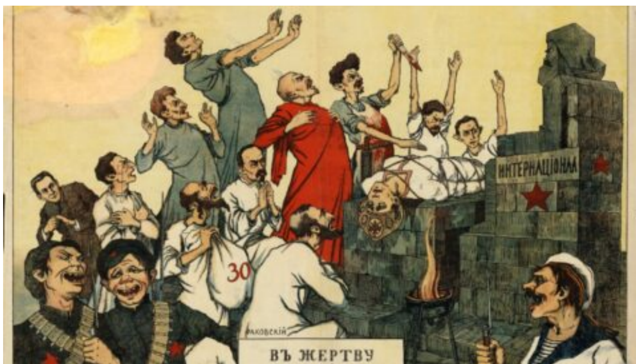
Česká petice znovu požaduje zákaz komunistické ideologie