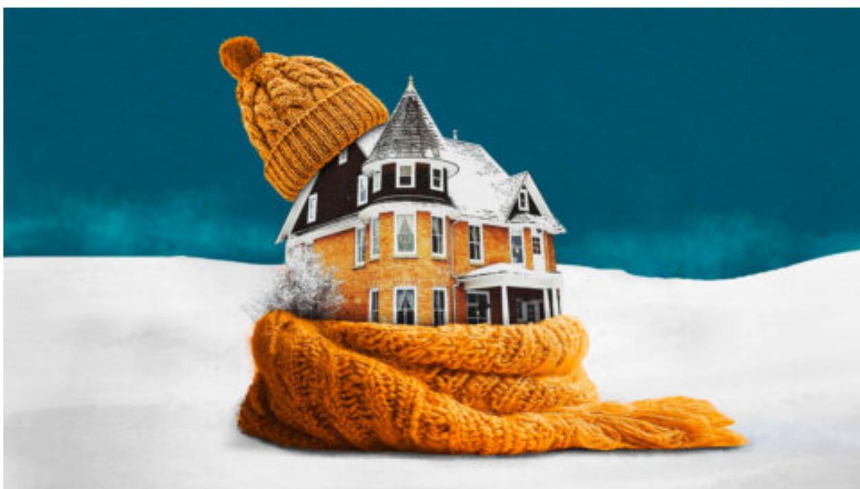
Náklady na vytápění domácností rostou. Proved'te tyto základní kroky, abyste snížili své náklady.

Z Havaje na Floridu po stopách Ryana Routha k jeho pokusu o atentát na Trumpa