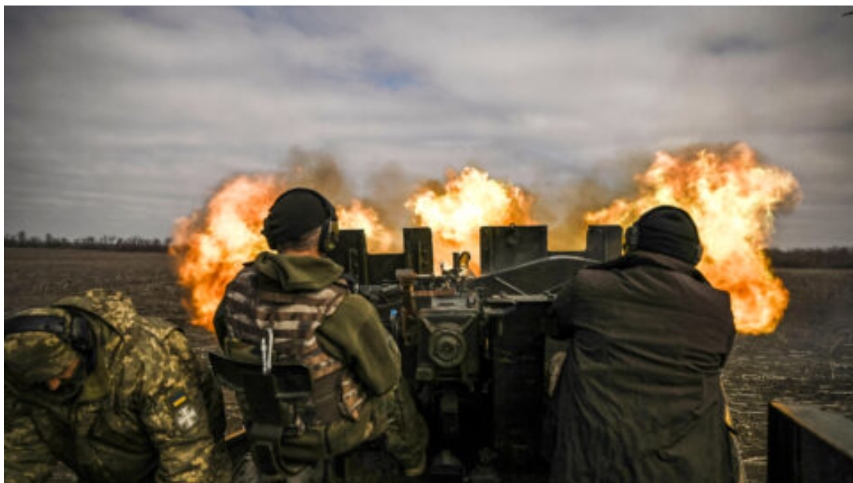
Jak se Harrisová a Trump staví k otázce Ukrajiny