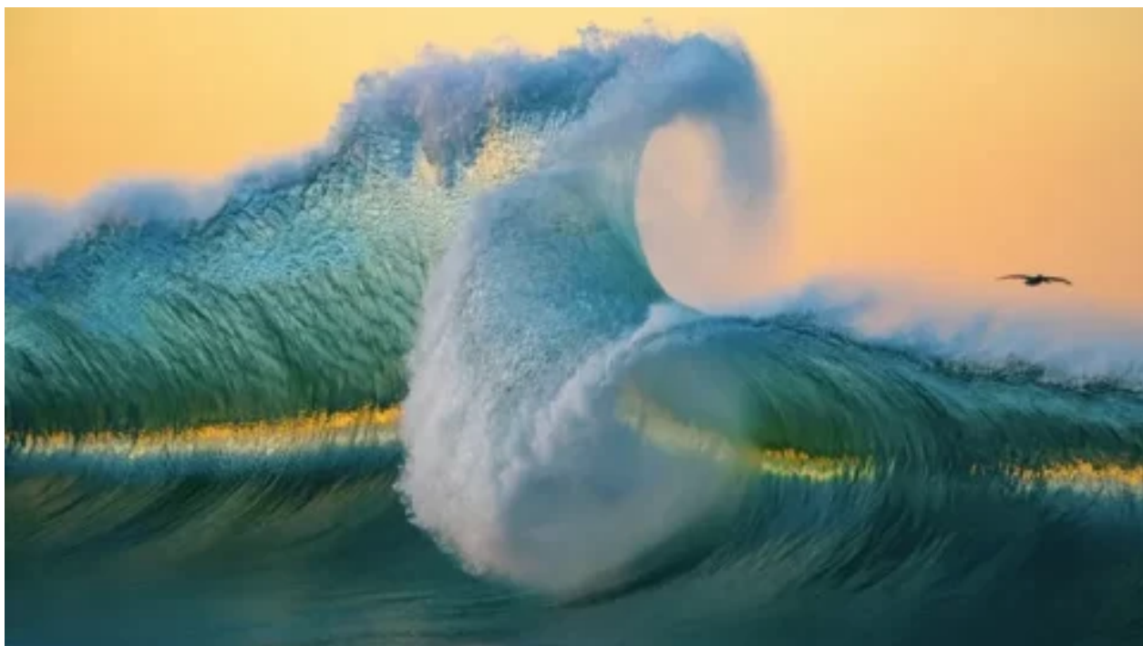
Nádherné snímky veľkých vln od uměleckého fotografa ilustrujú sílu oceánu