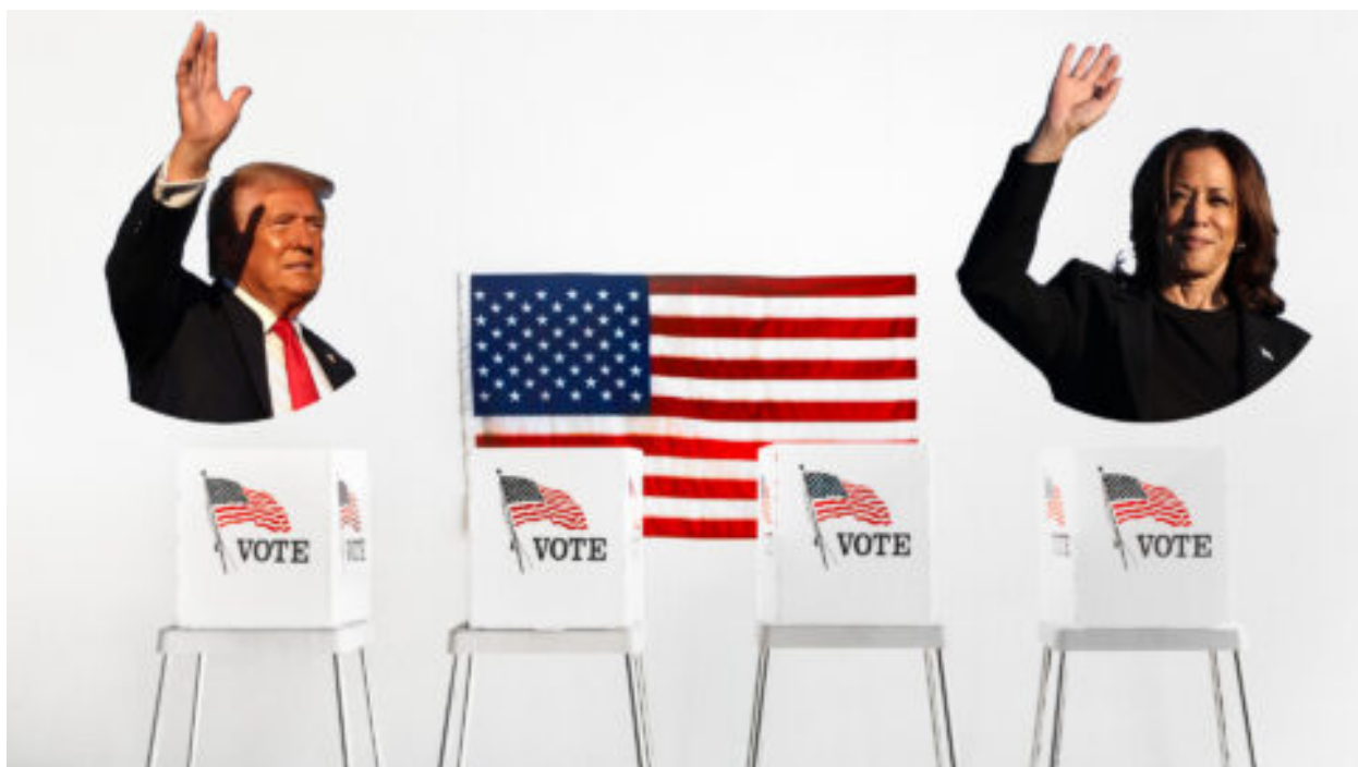
Rozhovor s naším newyorským reportérem o nadcházejících volbách v USA