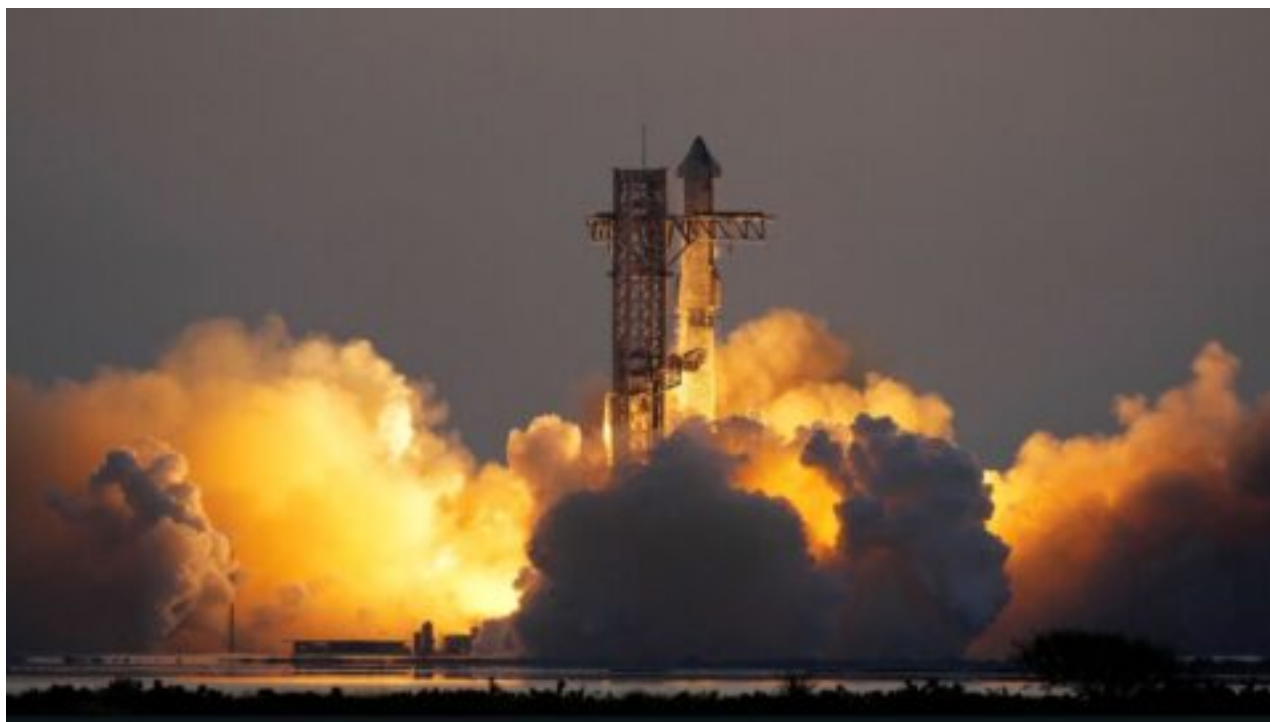
SpaceX zakončila pátý test Starship, kosmická loď řízeně dopadla do oceánu