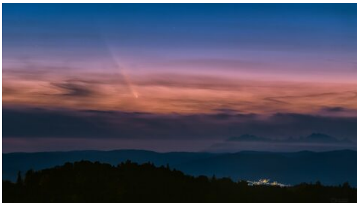
Viditelná i pouhým okem. Kde lze v Česku spatřit kometu Tsuchinshan-ATLAS v dalších dnech?