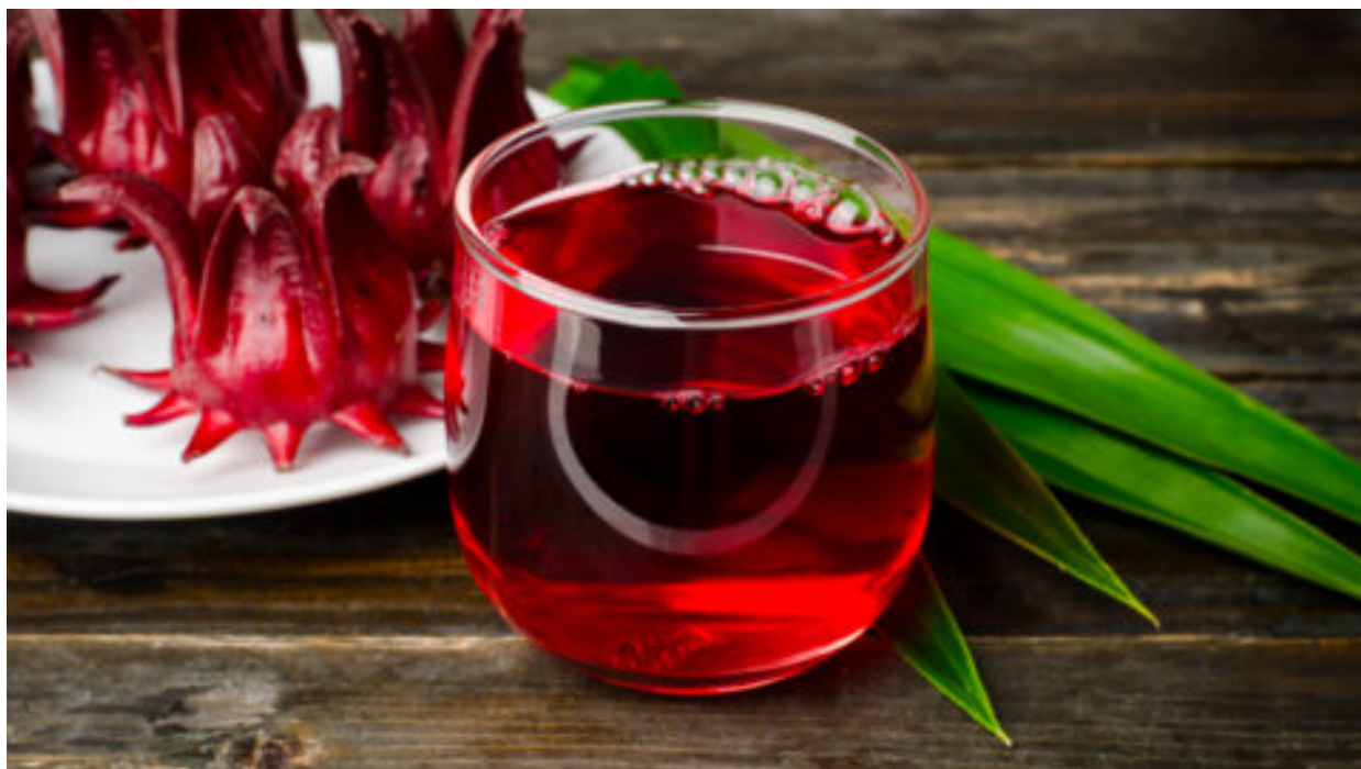
Superpotravina pro srdce, cukr v krvi a plet'