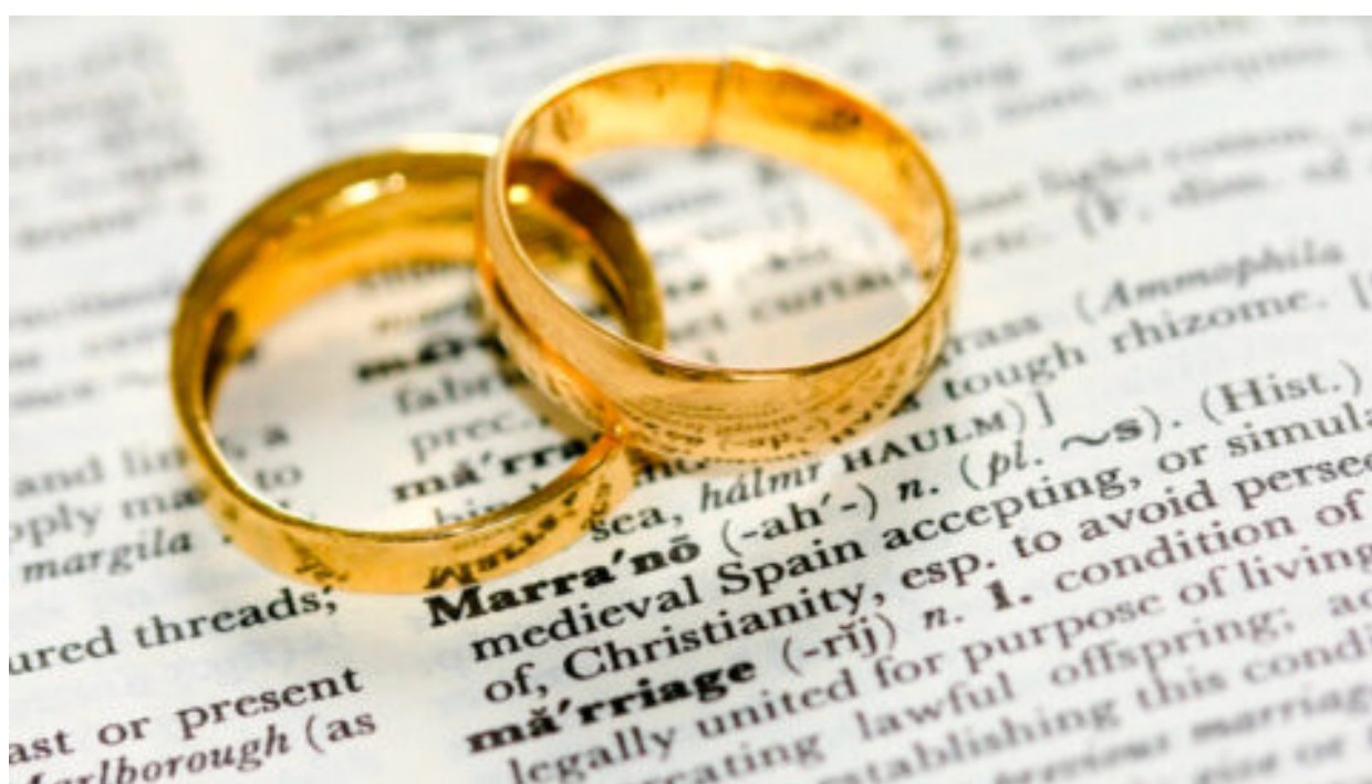
Proč podle sociologa lidé potřebují uzavírat manželství a mít rodinu?