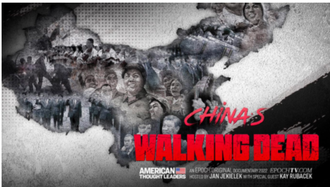
Čínské zombie. Exkluzivní dokument Epoch Times (VIDEO)