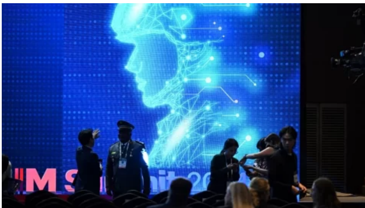
ČR a USA jsou mezi 60 zeměmi, které podepsaly plán pro vojenské využití AI. Čína se nepřipojila