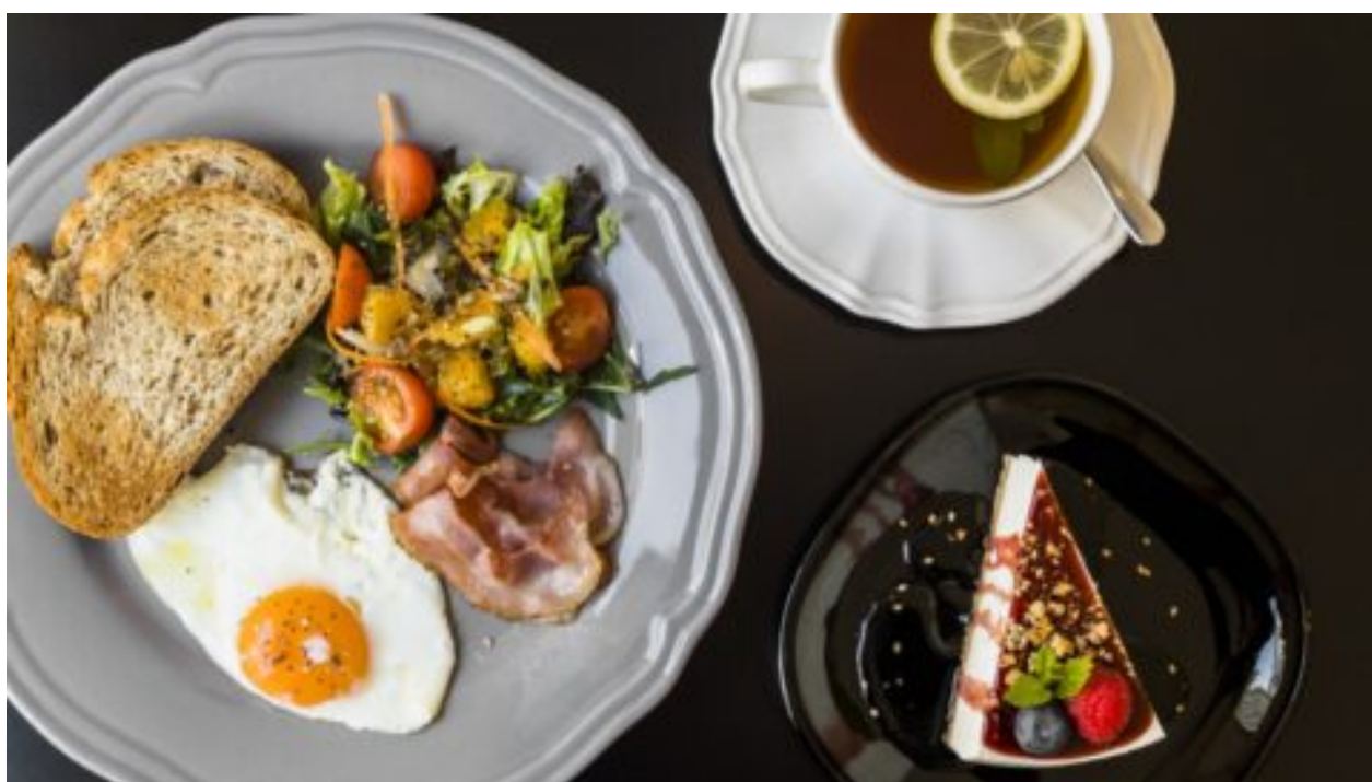
Přírodní lék pro duševní zdraví