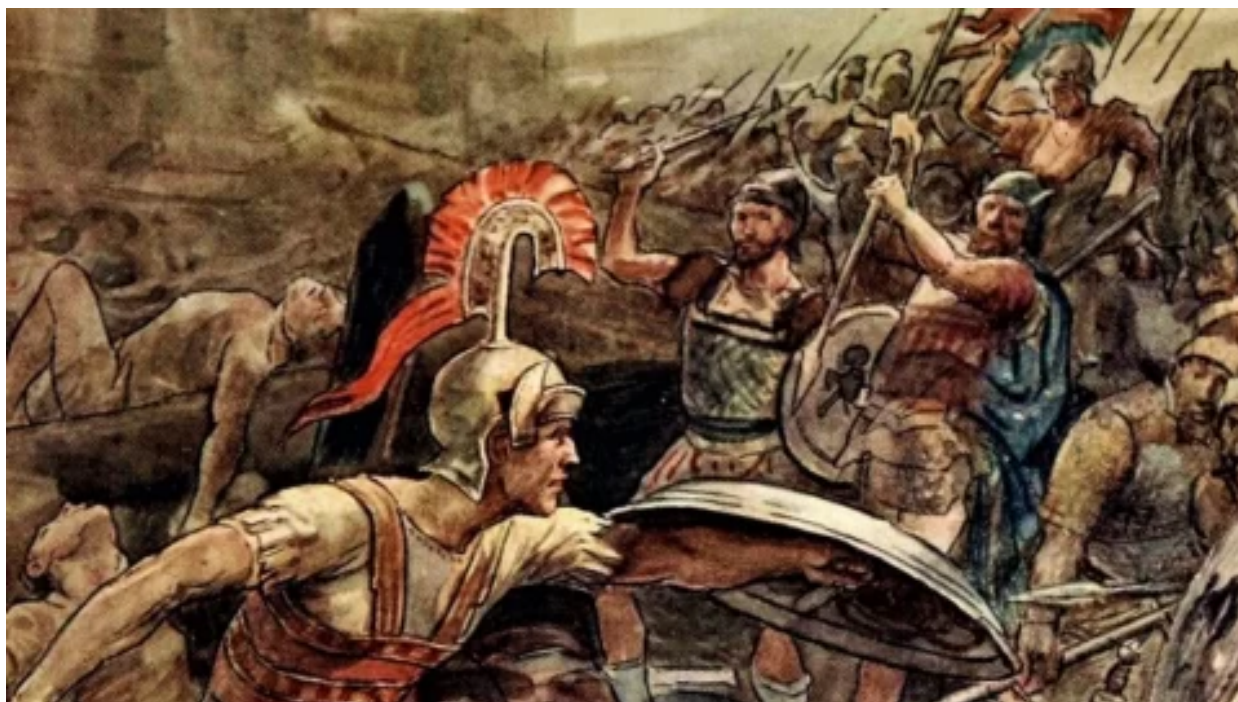
Muž, který ukončil tyranii ve Spartě