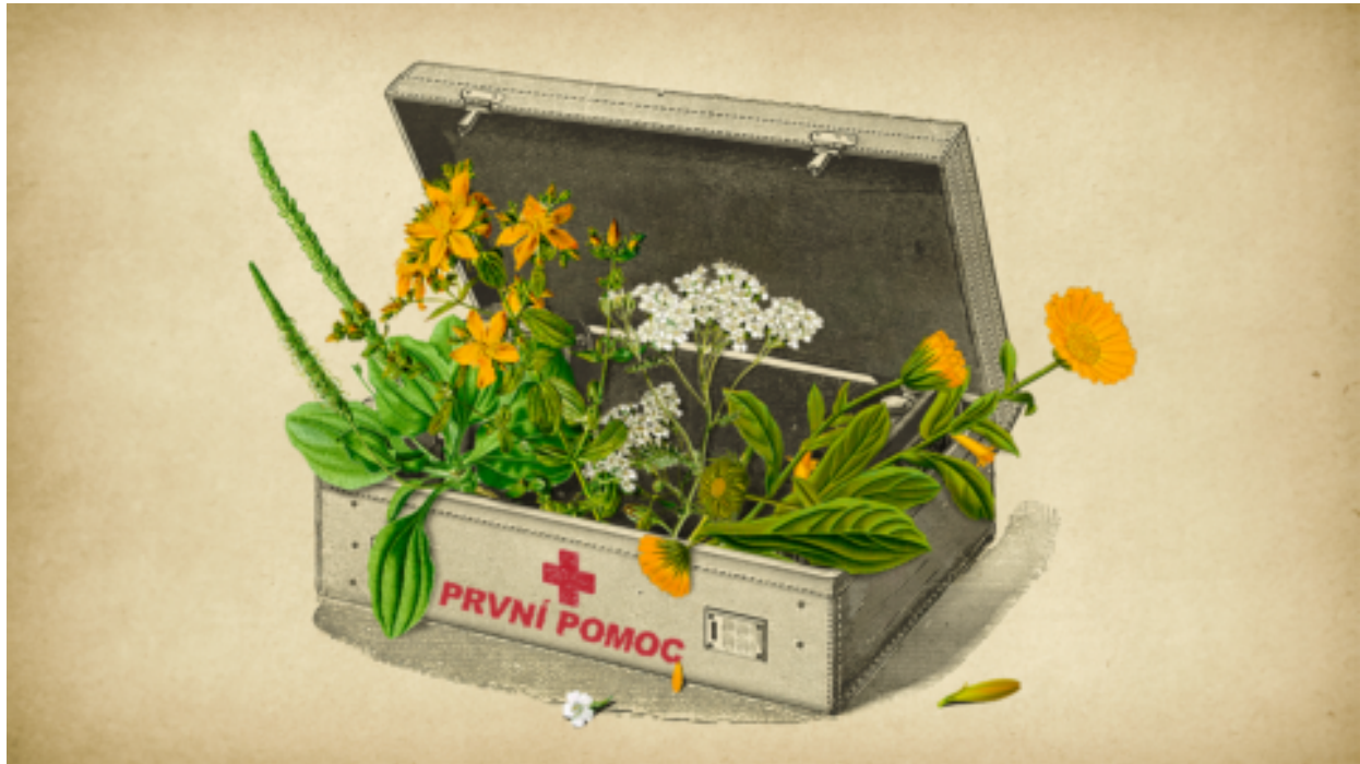
Jsem bylinkář a toto jsou 4 základní byliny v mé lékárnice první pomoci