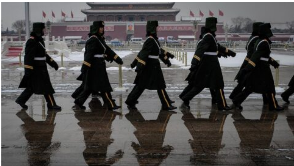
Čínský režim se snaží manipulovat USA ve snaze vystupňovat pronásledování Falun Gongu