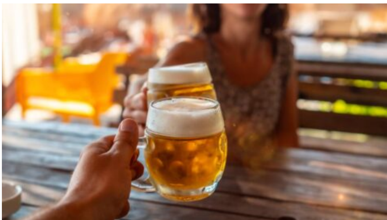
Počet Čechů, kteří pijí pivo klesá, stejně jako spotřeba, ukazuje průzkum