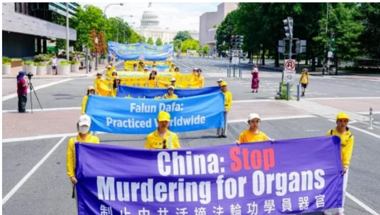
Zákonodárci z 15 zemí vyzvali čínský režim k ukončení pronásledování Falun Gongu