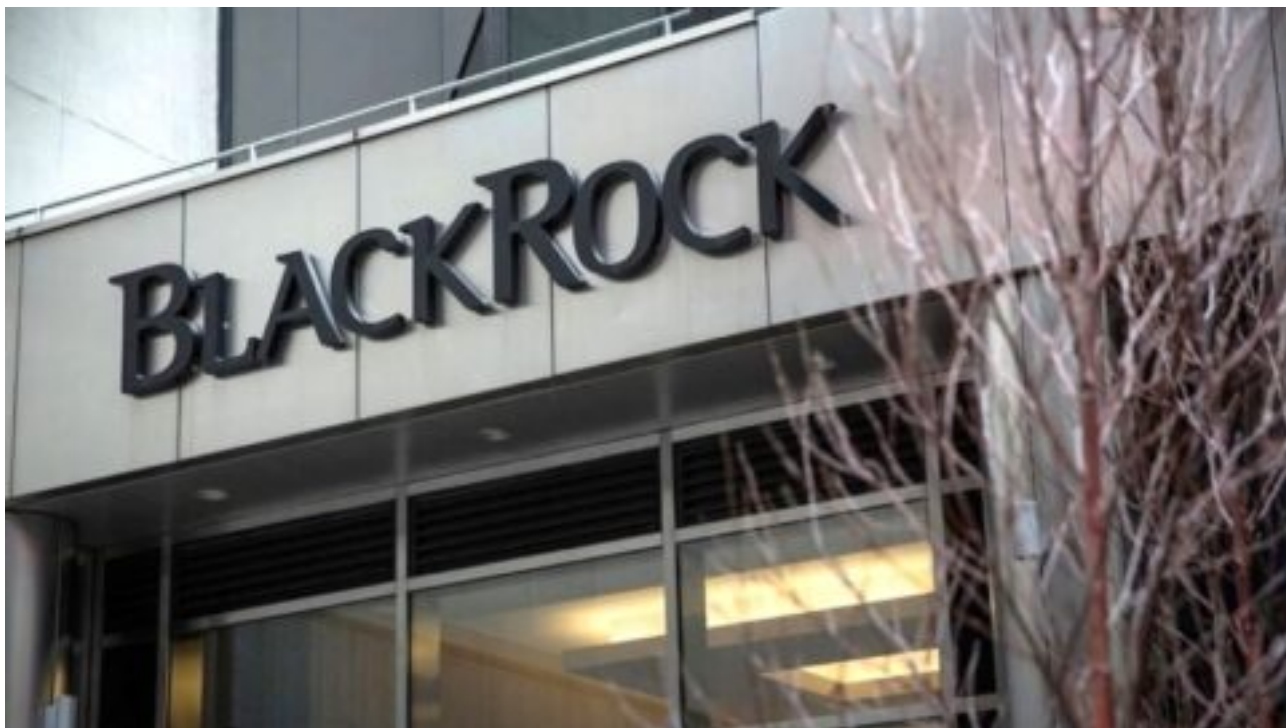
Investiční skupina BlackRock a německá politika – několik faktů