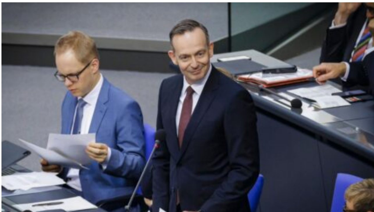
Bližící se konec milionů vozidel s dieselovými motory: EU se k tomu vyjadřuje a zůstává tajemná