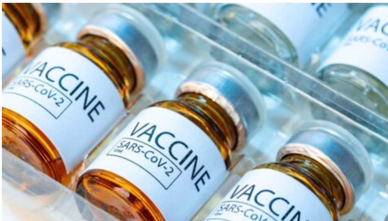
Česká studie ukazuje, že první šarže vakcín Pfizeru proti covidu vedly k větší míře nežádoucích účinků