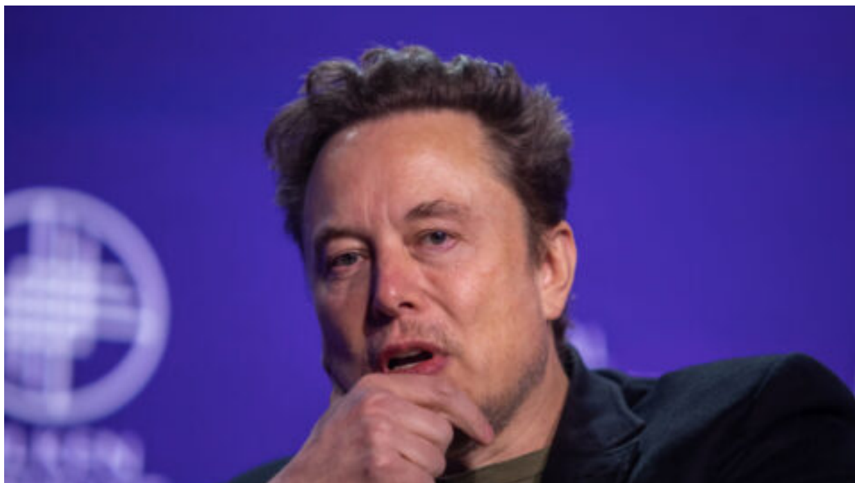
„Chtěli tajnou dohodu o cenzuře,“ obvinil Evropskou komisi Musk. X se bude bránit u soudu