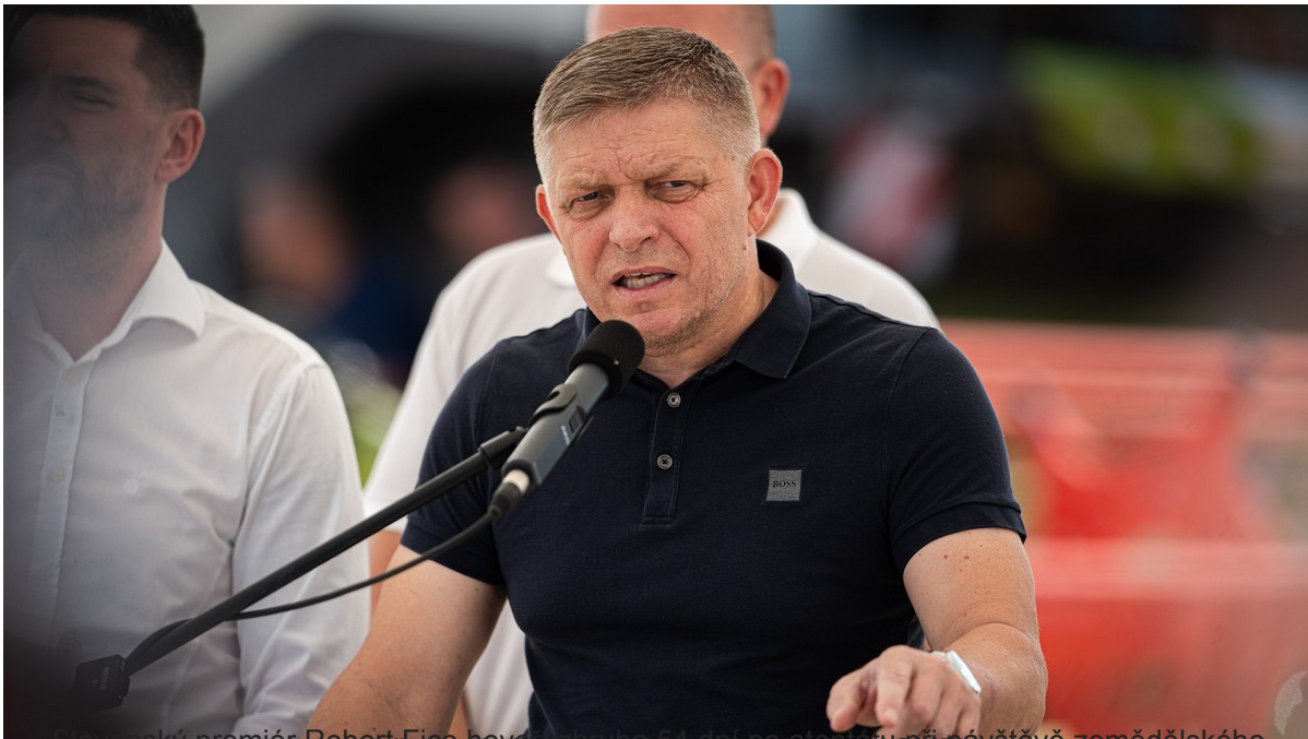
Slovenský premiér Robert Fico hovorí za mikrofonom pri návšteve zemiedělskeho družstva, 8. července 2024.

Deník Epoch Times požádal kabinet slovenského premiéra o komentář ke zveřejněné analýze a zároveň zaslal žádost Ministerstvu vnitra Slovenské republiky.