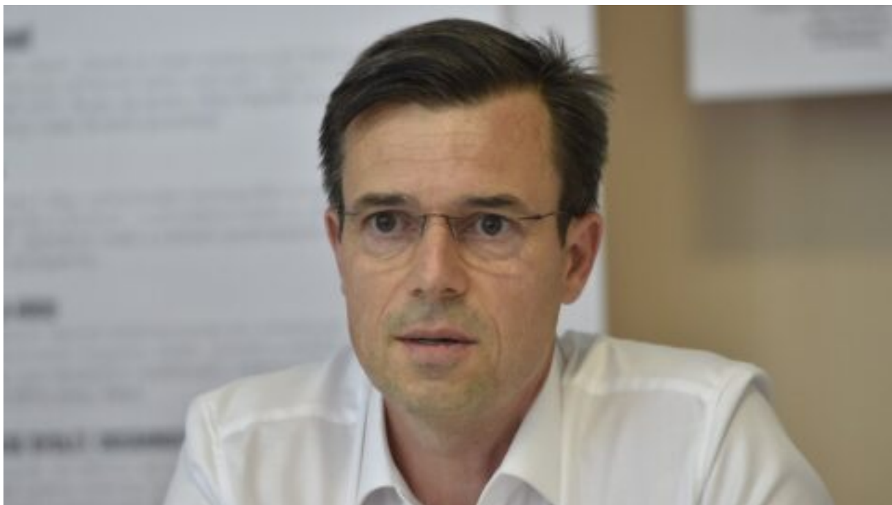
Zakladatel českých Pirátů vystoupil na protest ze strany.