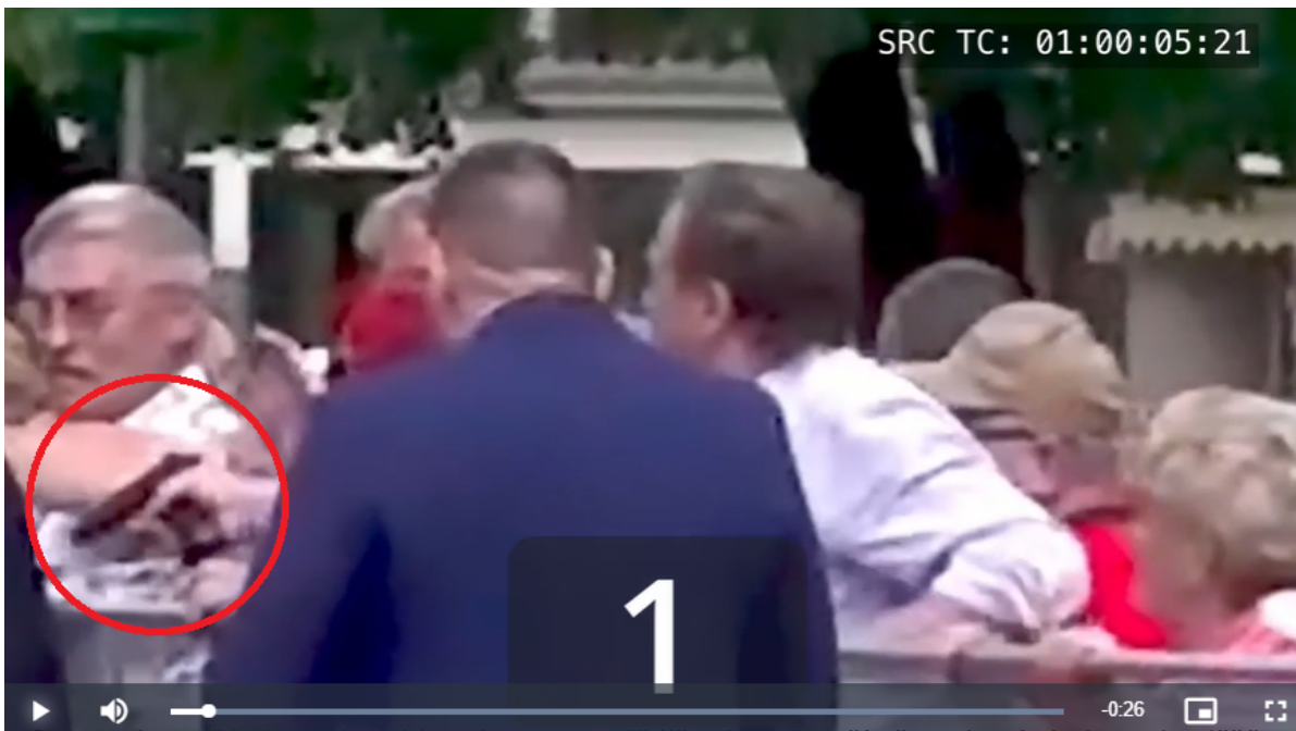
Screenshot z části analýzy videozáznamu z příblížení zaberu, čímž se dostává obraz do nižšího rozlišení. (Screenshot)

Milo v analytickém článku pokládá několik z jeho pohledu zásadních otázek, jako kolik bylo střel doopravdy či proč z útočnickovy zbraně nevychází kouř, který je obvykle při výstřelech patrný.