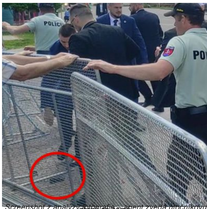
Screenshot z analýzy fotografie – agent zvedá útočnickovu zbraň ze země.