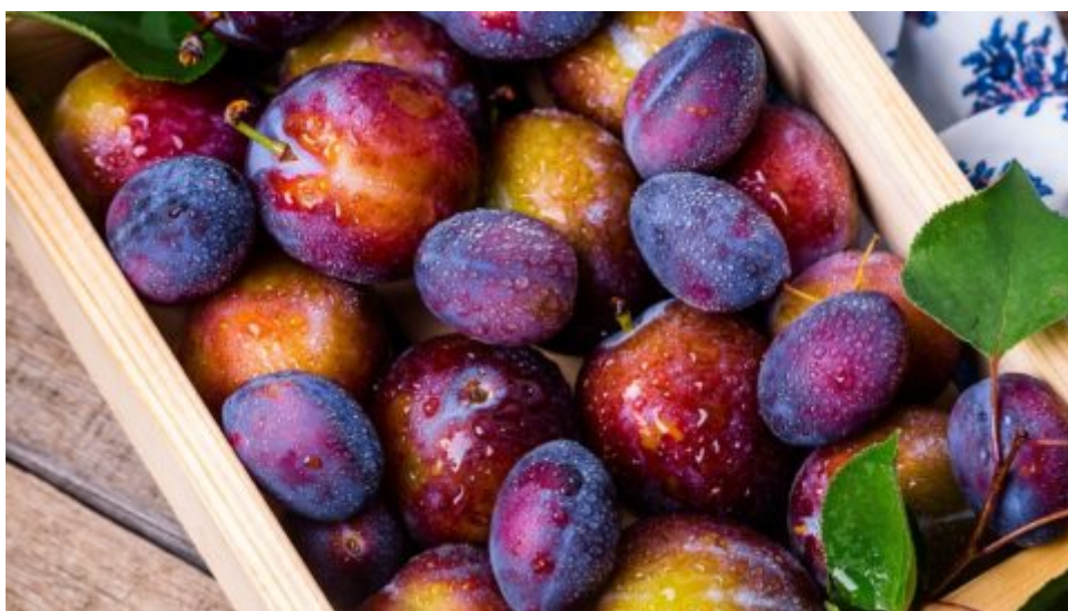
Zdravotní účinky kvercetinu sahají mnohem dál než jen k chřipce a nachlazení