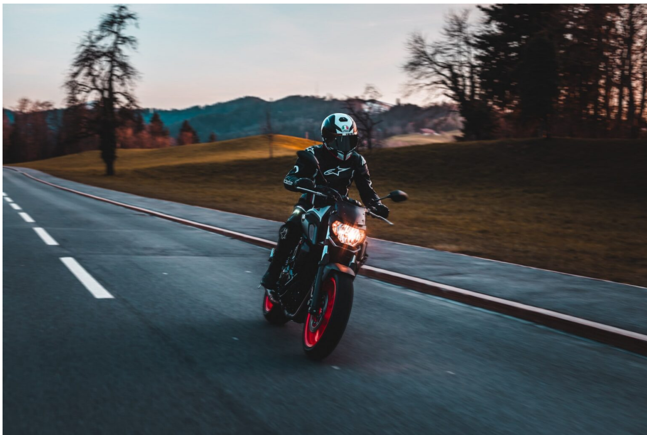
Jízda na motocyklu, ilustr. foto.

Oblasti dohledu se odráží na vytipovaných přestupcích, kde si policisté stanovili určitá hodnotící kritéria, efektivitu činnosti – prioritní oblasti. Viditelný dohled vyvažují dohledem skrytým.