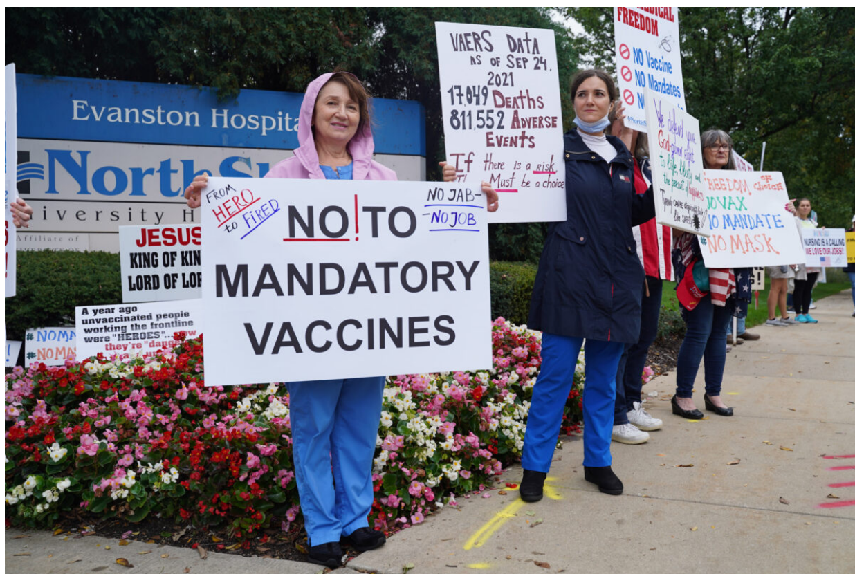
Zdravotničtí pracovníci NorthShore University HealthSystem protestují před Nemocnicí Evanston proti povinnému očkování; 12. října 2021.

Nedávno dosáhli zdravotníci v USA od svého zaměstnavatele vyrovnání ve výši 10 milionů dolarů kvůli povinnému očkování proti covidu. Žalobu podala v říjnu 2021 asi desítka zaměstnanců zdravotnického zařízení NorthShore University Health System ve státě Illinois, kteří tvrdili, že zařízení nezákonně odmítá náboženské výjimky z povinného očkování. V červenci 2022 se strany sporu dohodly na urovnání tohoto případu.