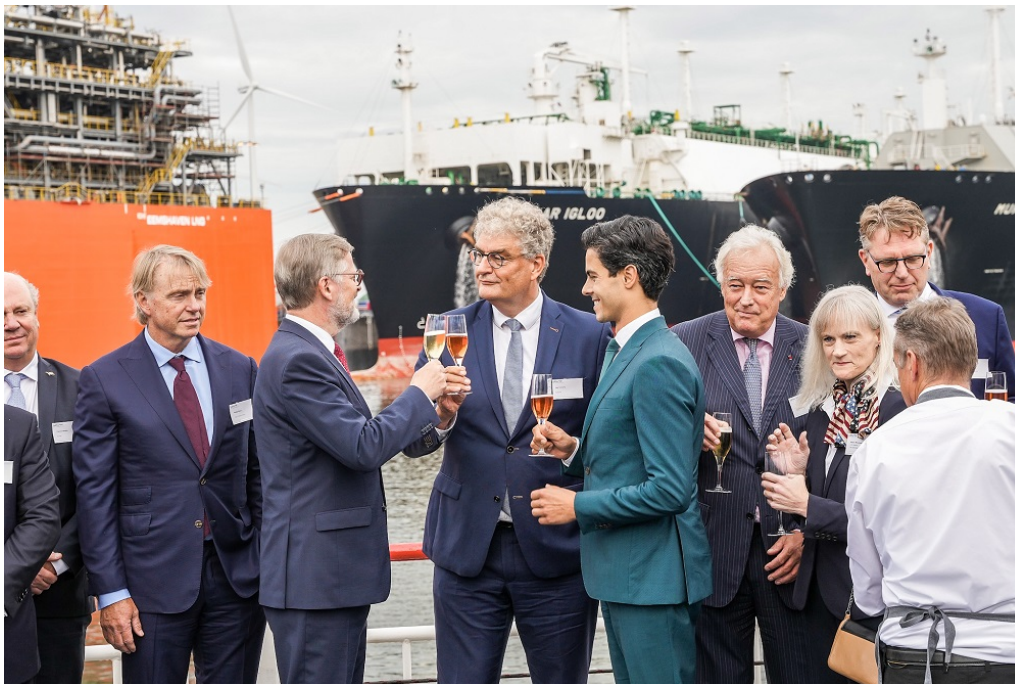
Slavnostní přípitek u příležitosti otevření zahájení provozu plovoucího LNG terminálu v nizozemském Eemshavenu, 8. září 2022.

Premiér Petr Fiala se podle tiskového střediska vlády ( zdroj ) 8. září 2022 zúčastnil slavnostního zahájení provozu plovoucího LNG terminálu v nizozemském Eemshavenu.