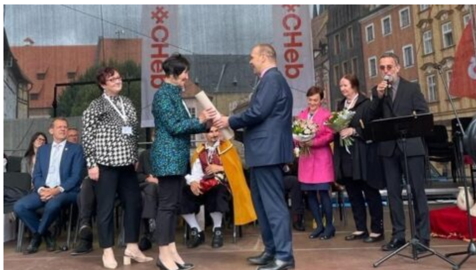
Ministr kultury předal tituly Nositele tradice lidových řemesel