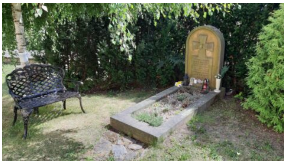
Lavička Jana Zrzavého v Krucemburku