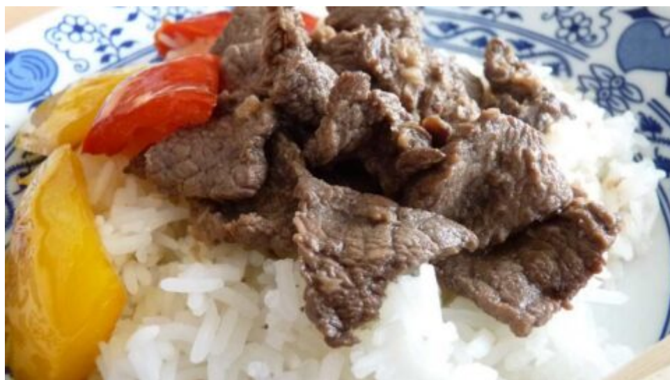
Recept: Hovězí po japonsku