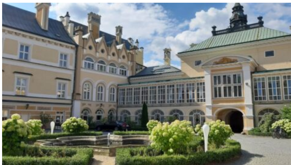
Světelský zámek je plný skvostů. Ukazuje čiré i barevné sklo