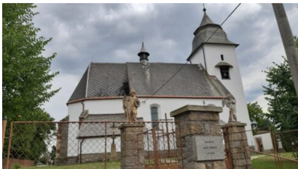
Číhošť: Žijme tak, jako bychom již dnes...