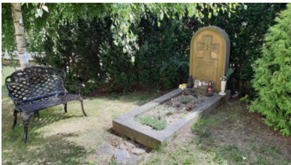
Lavička Jana Zrzavého v Krucemburku