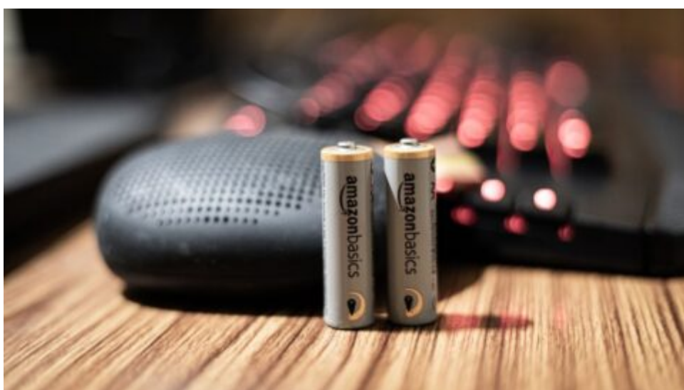
Edisonův vynález končí, není ekologický. 120 let výročí jeho patentu