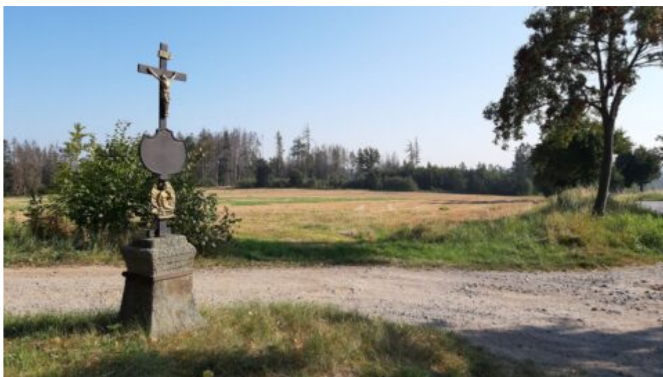
Pranostiky na měsíc srpen, závěrečný měsíc léta