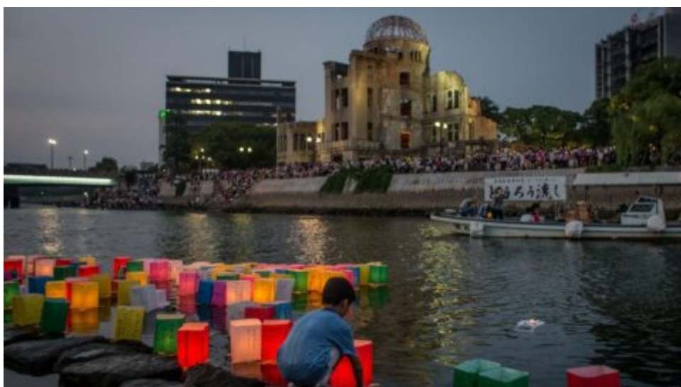
Japonsko zpřístupní města zničená atomovou bombou, aby svět viděl „realitu“ jaderné války