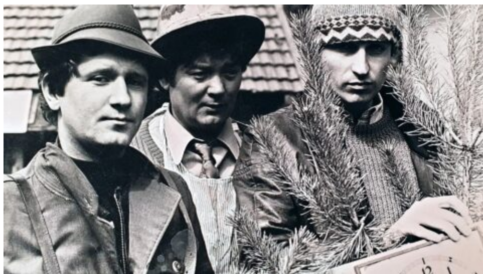
Milan Chladil – zpěvák obdařený lyrickým barytonem a noblesou