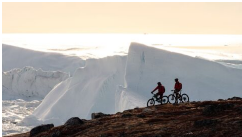
Grónsko – krajina, která zaručeně ohromí