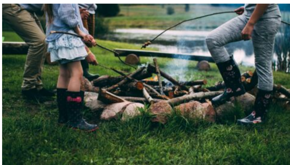
Vysočina: Trampský širák, 19. ročník, opět proběhne u Štoků na Hanesově mlýně