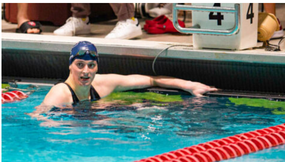
Pokus transgenderového biologického muže o titul sportovní asociace Žena roku nevyšel