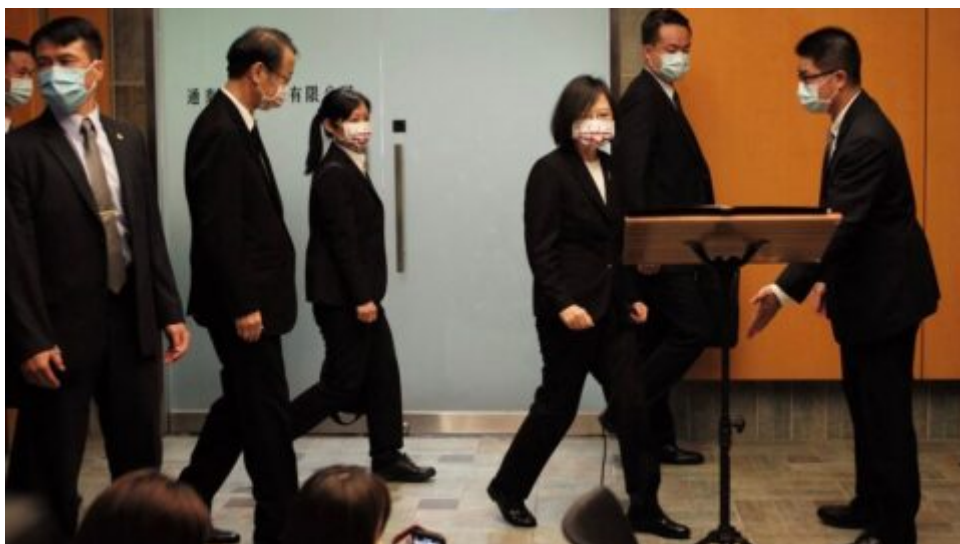
Japonsko při ojediné návštěvě Tchaj-wanu diskutuje o přípravách na konflikt