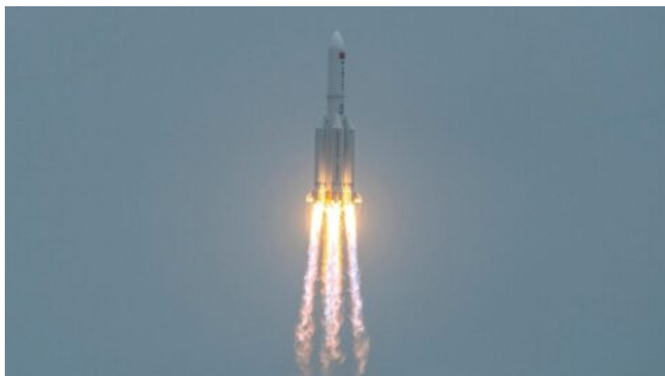
Další čínská raketa neřízeně spadla na Zemi