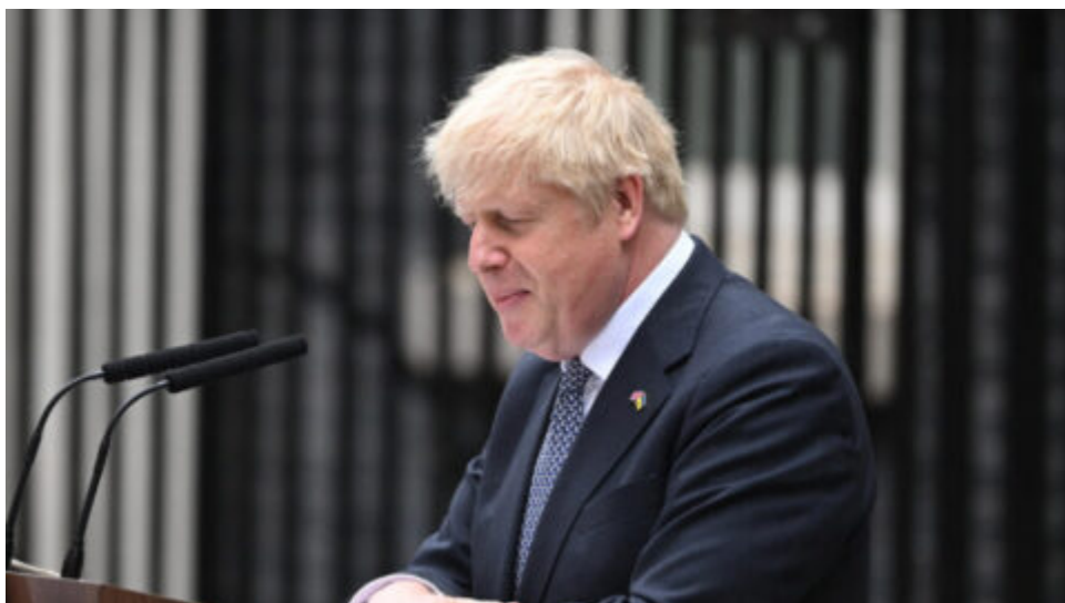
Boris Johnson oznámil rezignaci na post premiéra Spojeného království