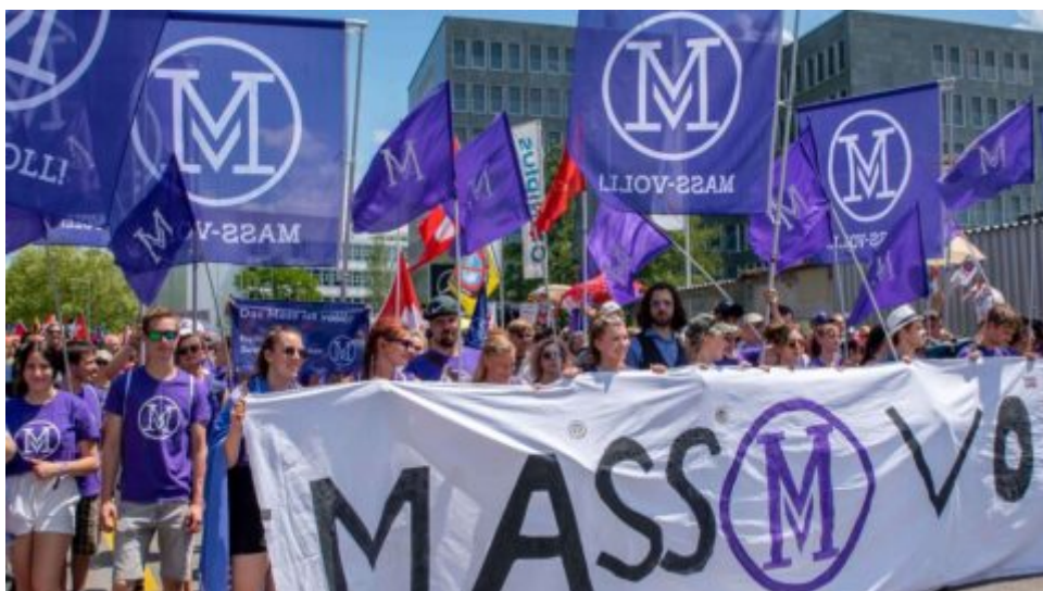
Švýcarská občanská iniciativa žádá „vystoupení země z WHO“