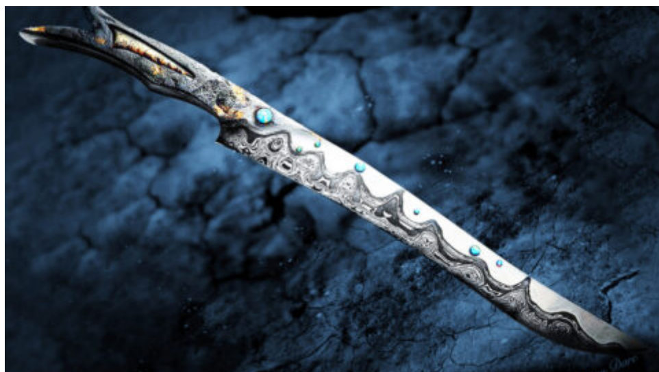
19letý mladík vykoval ze 4,5 miliardy let starého meteoritu „mimozemský“ nůž – a vypadá neskutečně