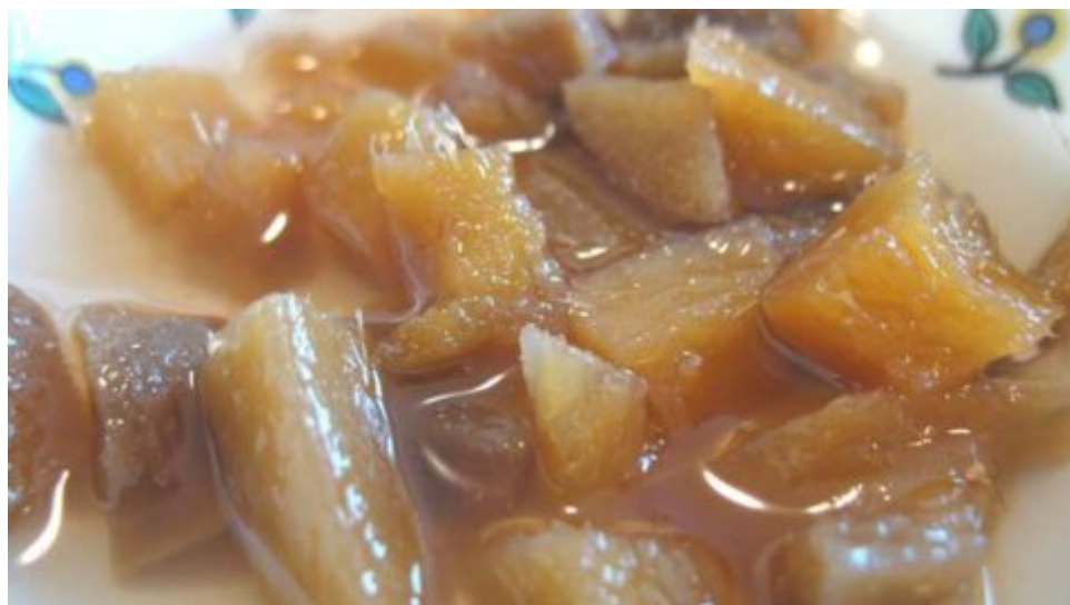
Recept: Zavařený zázvor