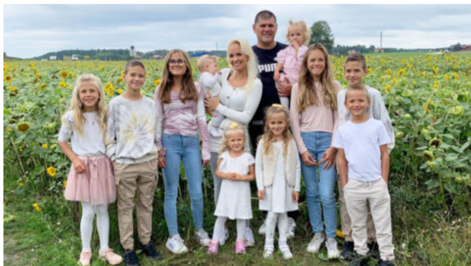
Žena, která si myslela, že nikdy neotěhotní, má teď deset dětí