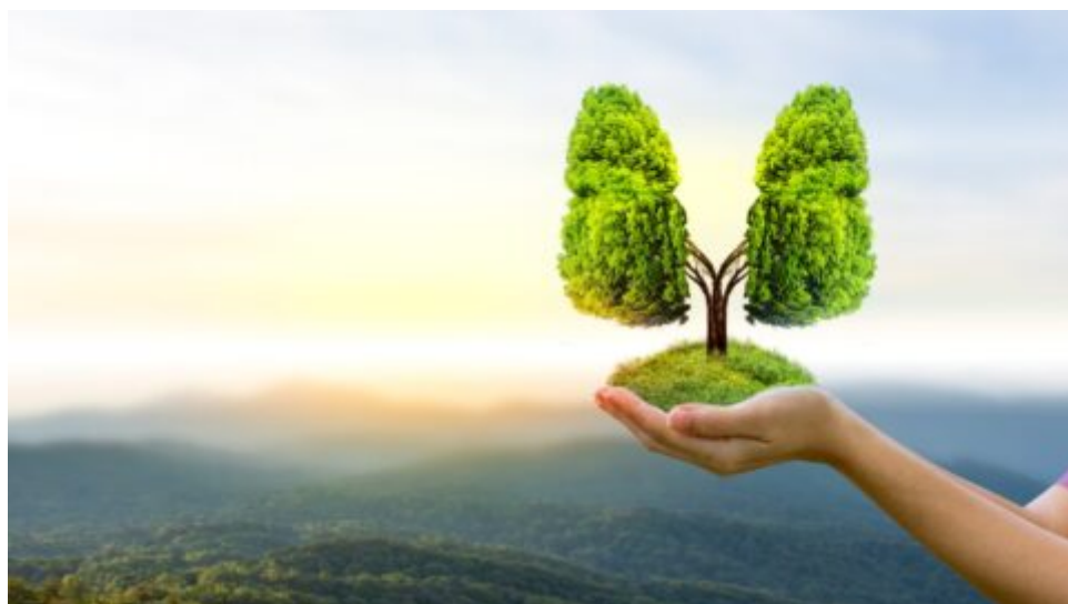
Červenec bez plastů: Změna závisí také na postoji spotřebitelů