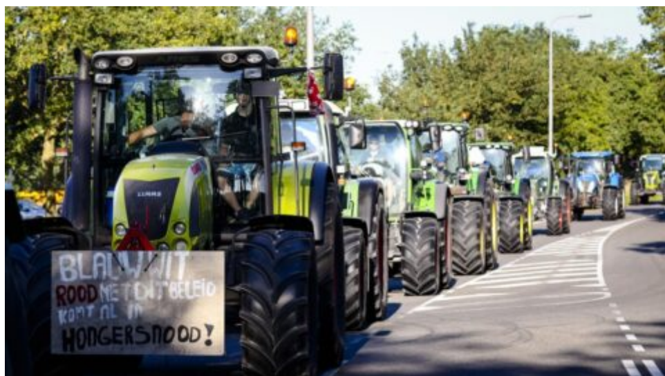
Nizozemští zemědělci se bouří proti Velkému resetu, říká přední politik