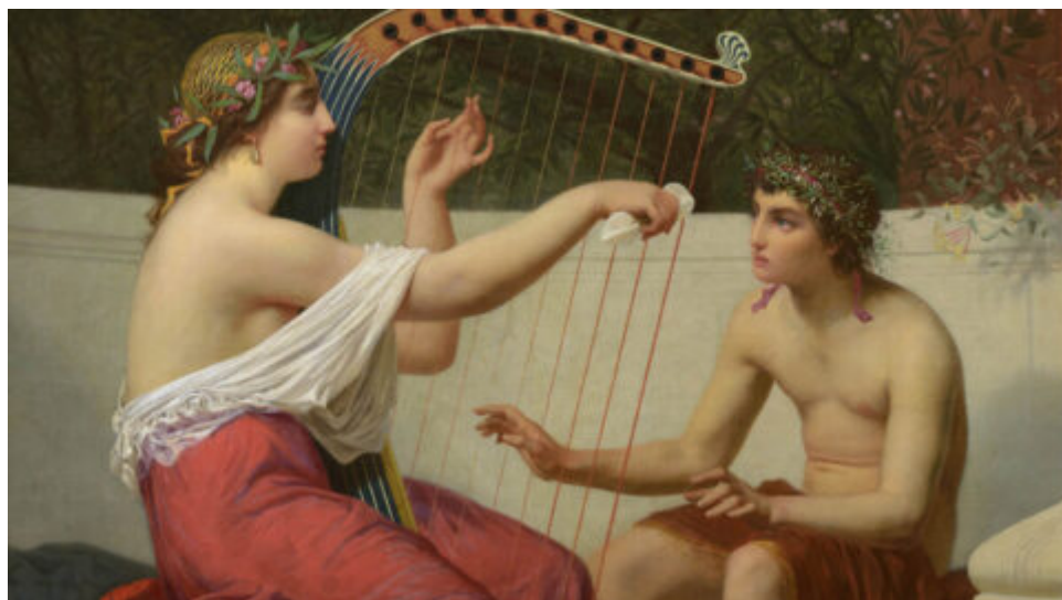
Alegorie věčné krásy.