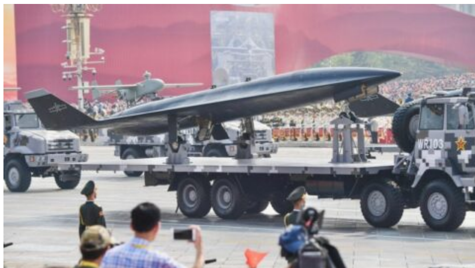
Čínský „Ču-chaj Jün“: první nosič dronů na světě řízený umělou inteligencí