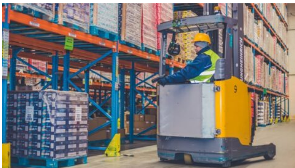
Důsledkům války čelíme napříč odvětvími – mimořádné ekonomické jevy.