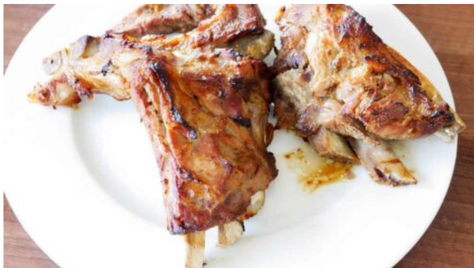
Recept: Žebírka s pивní marinádou – skvělá na grilu i v troubě