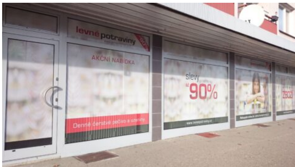
Levné potraviny pro chudé i bohaté – a to dnes