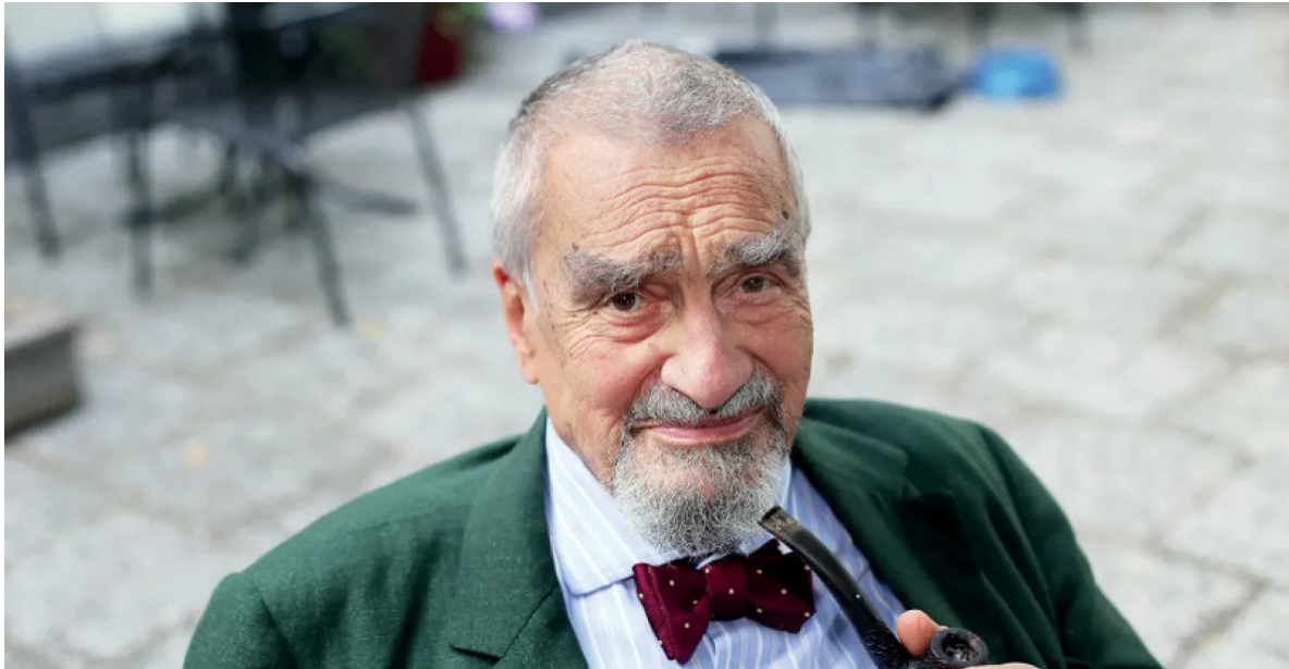
Karel Schwarzenberg (85) zhodnotil situaci Ukrajiny.