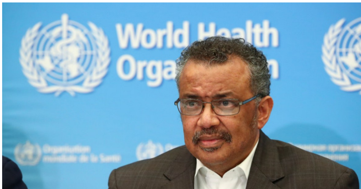
Generální ředitel WHO Tedros Adhanom Ghebreyesus.