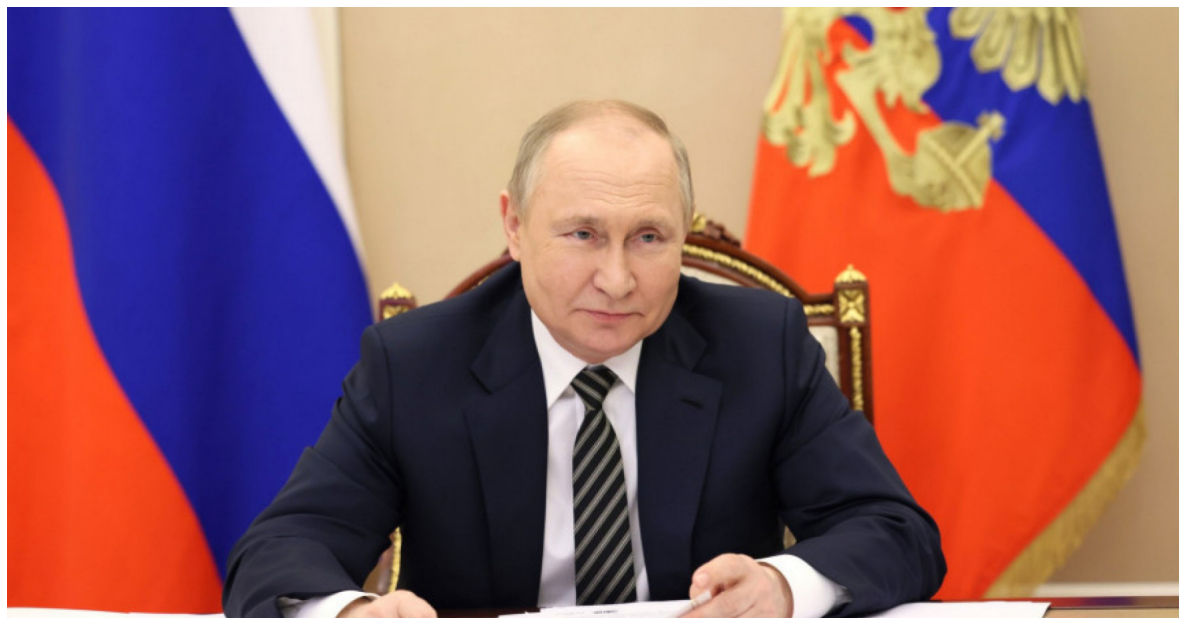
Ruský prezident Vladimir Putin.