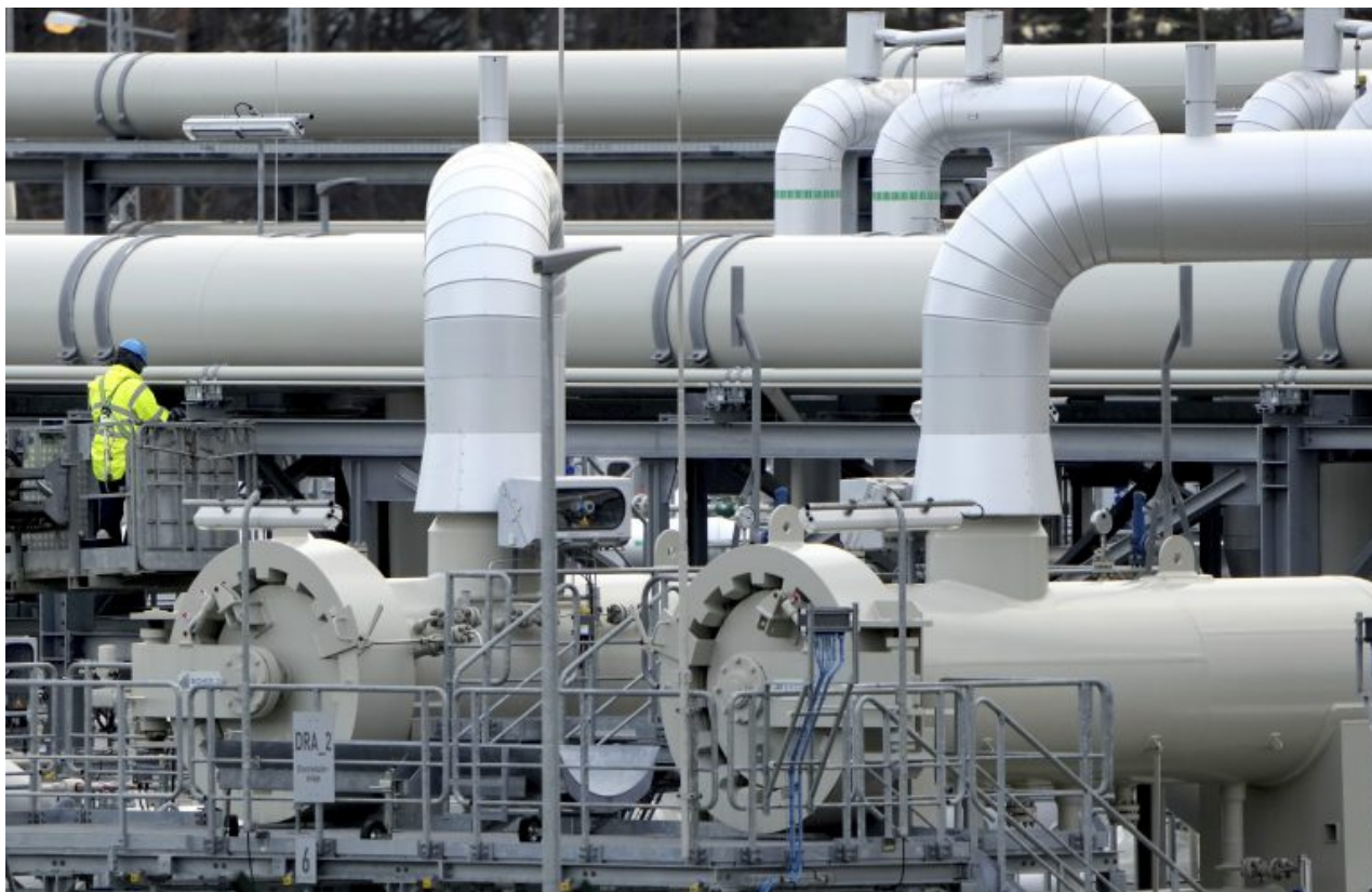
Na snímku potrubí na plynovodu Nord Stream 2 (Severní proud 2) v Lubmine na severozápadě Německa

Někteří analytici se domnívají, že plynovody byly napadeny hlubinnými náložemi nebo to učinily speciální jednotky. Přestože ani jedna vláda USA, Ruska nebo Německa oficiálně neobvinila žádnou stranu z "úmyslné sabotáže", západní a ukrajinská média rychle prohlásila, že na plynovody Nord Stream zaútočilo Rusko. Ruská média nebyla schopna bojovat proti takovým obviněním.