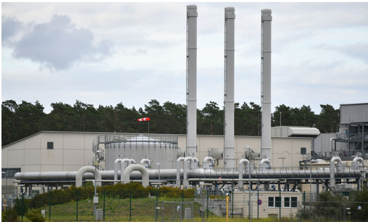
Fotografie ze 14. září 2022 zobrazuje zařízení plynovodu Nord Stream 1 v Lubminu v Německu.

Pokud se zničí plynovod Nord Stream, Ukrajina získá zjevné výhody mezi evropskými zeměmi, protože pozemní plynovod do Evropy přechází přes Ukrajinu, a tím se zcela eliminují očekávání Ruska týkající se plynovodu Nord Stream, což pomůže posílit podporu Německa pro Ukrajinu. Ukrajina však nemá přístup k Baltskému moři, jak to může udělat?