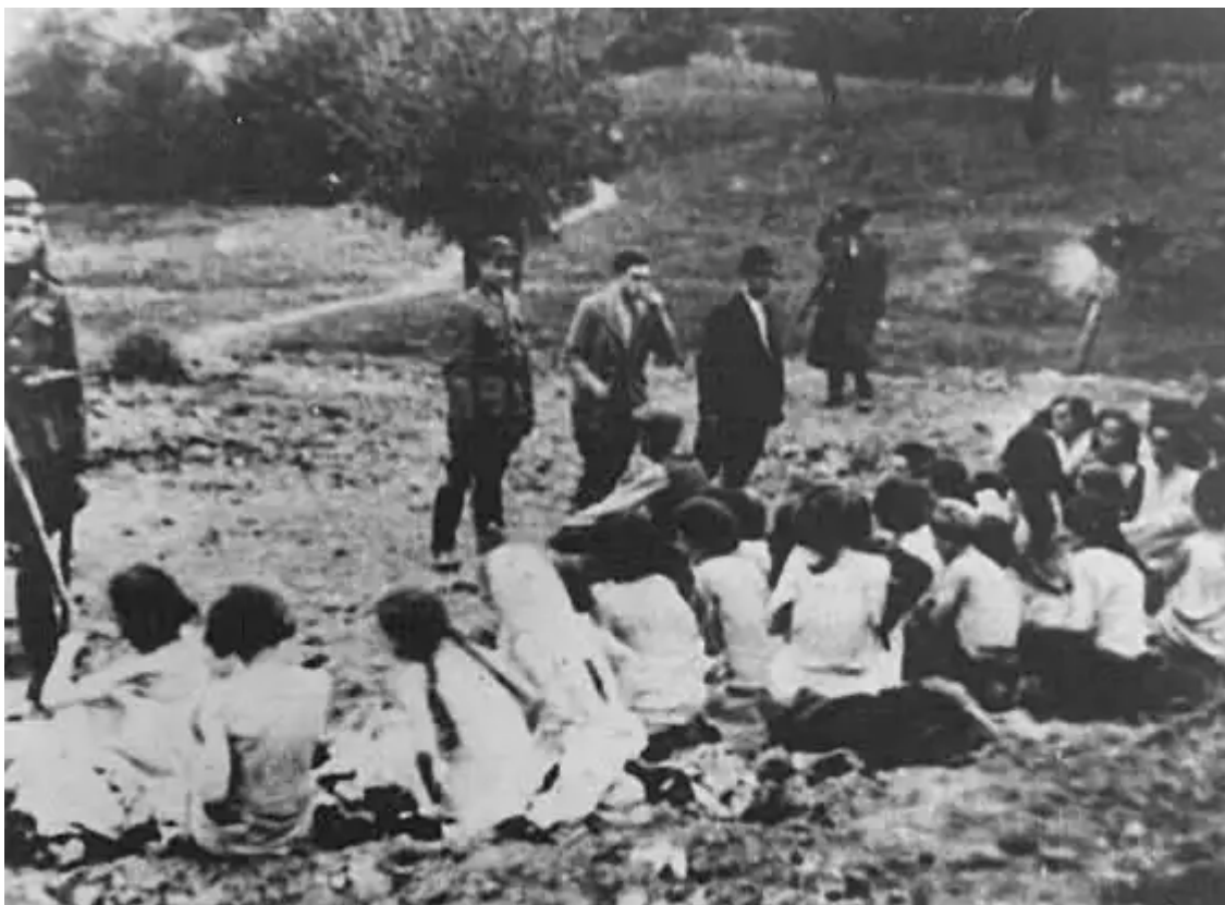
Židovské ženy před zastrelením v Babí Jar, september 1941.

„Ukrajinské obyvatelstvo s velkou radostí přijalo ustanovení spravedlivé německé vlády, jejímž nositelem jste vy, pane generální guvernére. Tuto radost vyjádřil ukrajinský lid nejen květinami, kterými obházeli německé vojáky, kteří vstoupili do regionu, ale také krvavými oběťmi, které si boj proti polským uzurpátorům vyžádal “- takovou výzvu zveřejnili v listopadu Krakovské zprávy 1, 1940, lichotivě presviecici připraveni „na radostnou spolupráci“, a přání Fuhrera a jeho zástupců na východě „uskutečnit plány na nové uspořádání Evropy“.