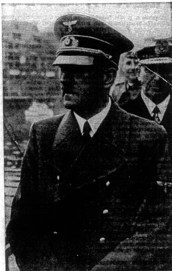
ФІРЕР ВЕЛИКОЇ НІМЕЦЬКОЇ АДОЛЬФ ГІТЛЕР СВАТКУЄ 61. УРОДНИН.

Сьогодні йде гігантський бій з тими, які протиставились волі Адольфа Гітлера закріпити силу німецького народу й німецької держави на підвалинах, що їх признав Гітлер за необхідні. Осьмий місяць йде війна та значить на календарі безупинну чергу перемог — дипломатичних і стратегічних. Ворожа німцям пропаганда каже, що це йде війна з Гітлером. У своїй безмежній