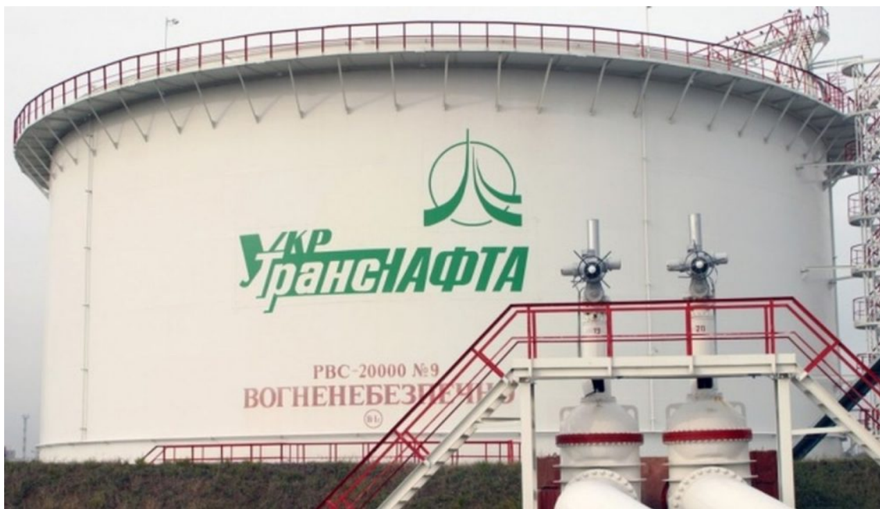
Ropný zásobník ukrajinské firmy UkrTransNafta

Každému muselo být jasné, že jakmile se v balíčku tato páka objeví, tak Ukrajina ji bez mrknutí oka použije proti Maďarsku, ale současně i proti Slovensku a Česku. Fiala tak poskytl Zelenskému do ruky dranzírovací nůž, kterým teď podřízl nejen Maďarsko, ale i Slovensko a Česko. Maďarská společnost MOL v úterý odpoledne oznámila, že vstoupila do jednání s ukrajinskou stranou, že platby za dodávky ruské ropy ropovodem Družba bude hradit sama, tedy ruský Transněft bude dodávat ropu do Družby, ale Ukrajině bude zálohy za použití ropovodu platit maďarský MOL, čímž se obejde ustanovení 7. sankčního balíku z Fialovy dílny, uvedl tiskový mluvčí MOL pro ruskou agenturu RIA Novosti.