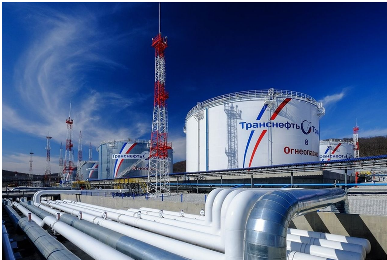
Ropné zařízení Transněftu

[1] Transněftu platbu za tranzit ropy ropovodem přes území Ukrajiny, a to s vysvětlením, že Ukrajina již nemůže zálohu na transport ropy akceptovat.