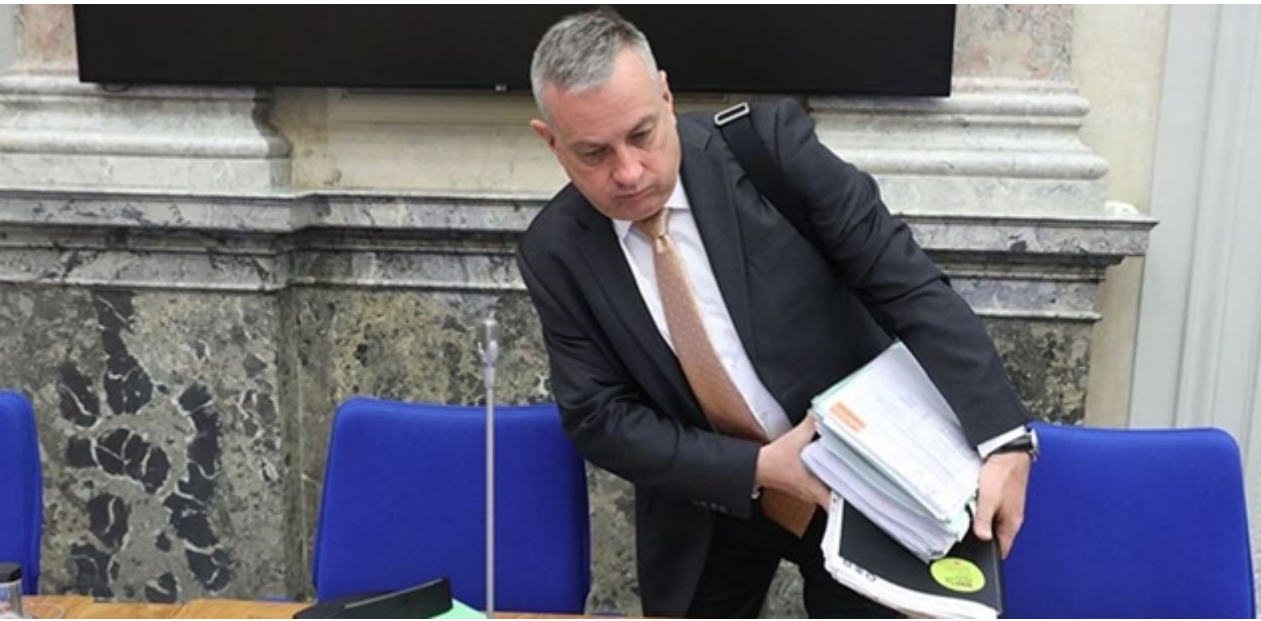
Popisek: Josef Síkela, ministr průmyslu a obchodu

Se zdražováním energií chce vláda bojovat pomocí plošné podpory pro firmy i domácnosti, jež bude limitovaná na určité odebírané množství. Ministr průmyslu a obchodu Jozef Síkela (za STAN) oznámil, že by se tak mělo dít pomocí „úsporného tarifu“, který pokryje 15 až 20 % cen energií.