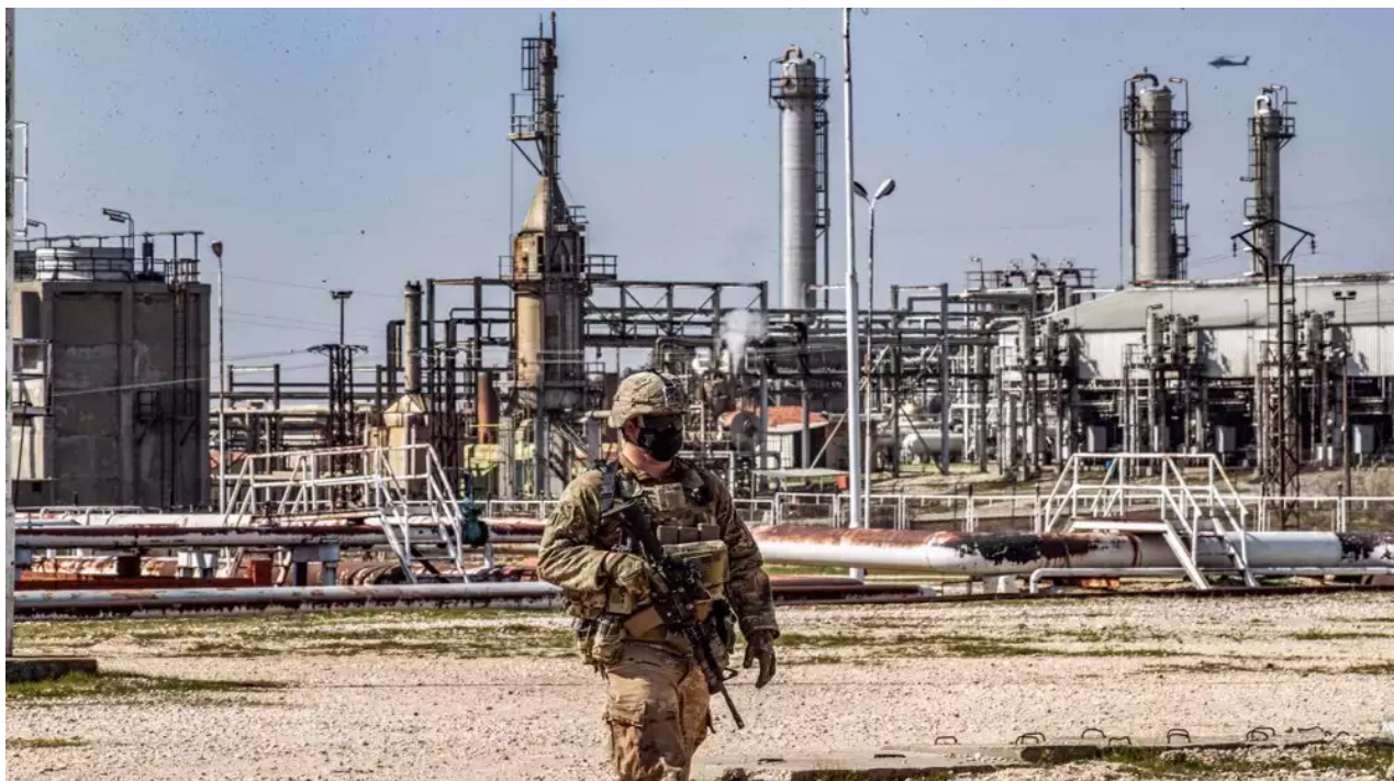
Americký voják během hlídky u ropných polí Suwaydiah v provincii Hasakah na severovýchodě Sýrie

odporu příslušníků kurdských formací, ale také aktivaci militantů Islámského státu. Dalším potvrzením je útok na teroristický záchytný tábor v Al-Khol, jakož i pozastavení operací syrských demokratických sil proti extremistům z IS.