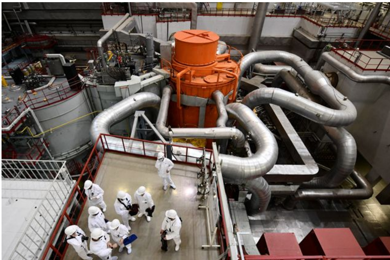
Reaktor BN-800.

Jedná se o přelomovou událost pro domácí i světový energetický průmysl. Aif.ru vysvětluje proč.