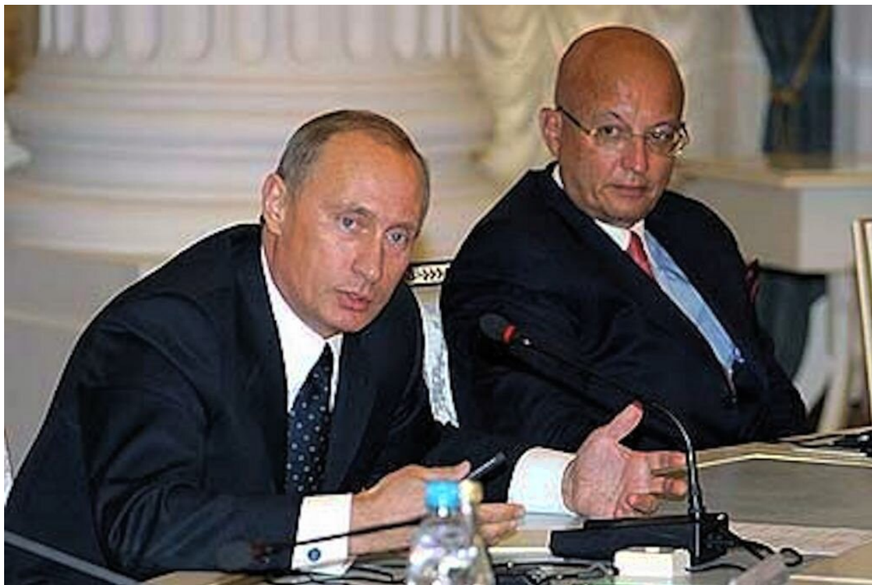
Vladimir Putin a Sergej Karaganov

Pokud Vás článek zaujal, nezapomeňte jej sdílet s Vašimi přáteli!