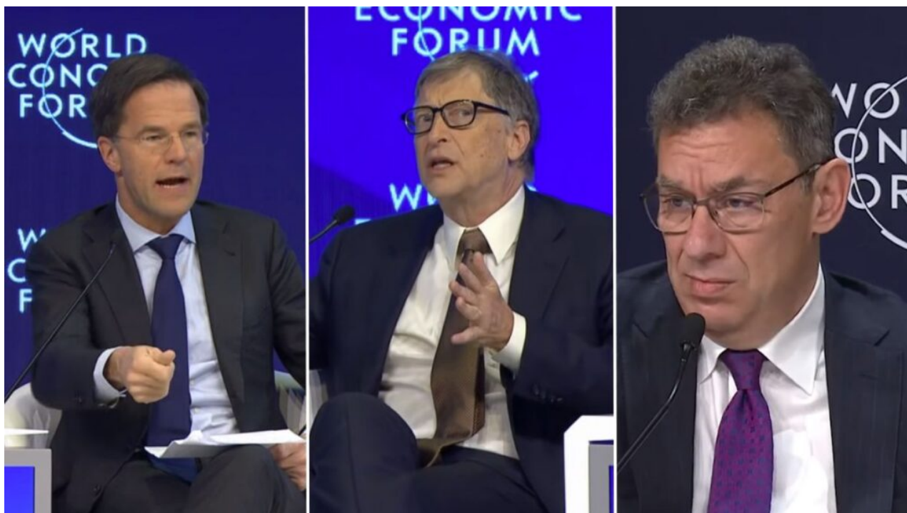
Z leva: Mark Rutte, Bill Gates, Albert Bourla