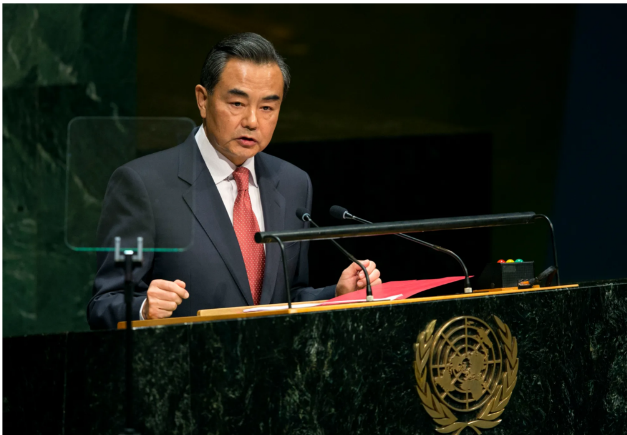
čínský ministr zahraničí Wang Yi

Wang podle agentury Reuters novinářům řekl, že jednali o nutnosti vyhnout se eskalaci konfliktu, zamezit použití zbraní hromadného ničení a zabránit útokům na jaderné elektrárny.