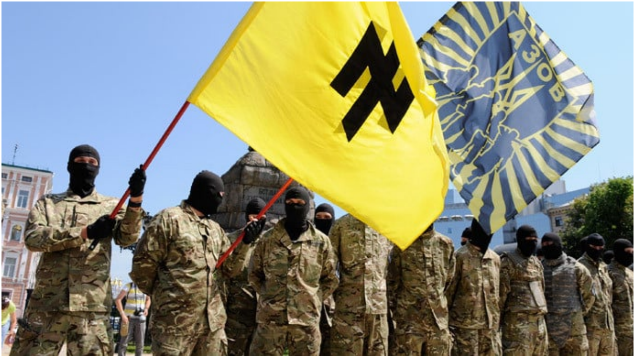
Bojovníci AZOV s Nacistickým symbolem SS "Wolfsangel" (Vlčí hák/ Werwolf)

Jsou to nacističtí teroristé, kteří zabíjejí děti v Donbasu. Jejich legitimitu mlčky podporuje Mezinárodní společenství, které je štědře financuje.