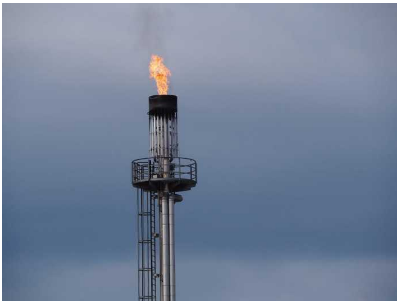
Ilustrační obrázek