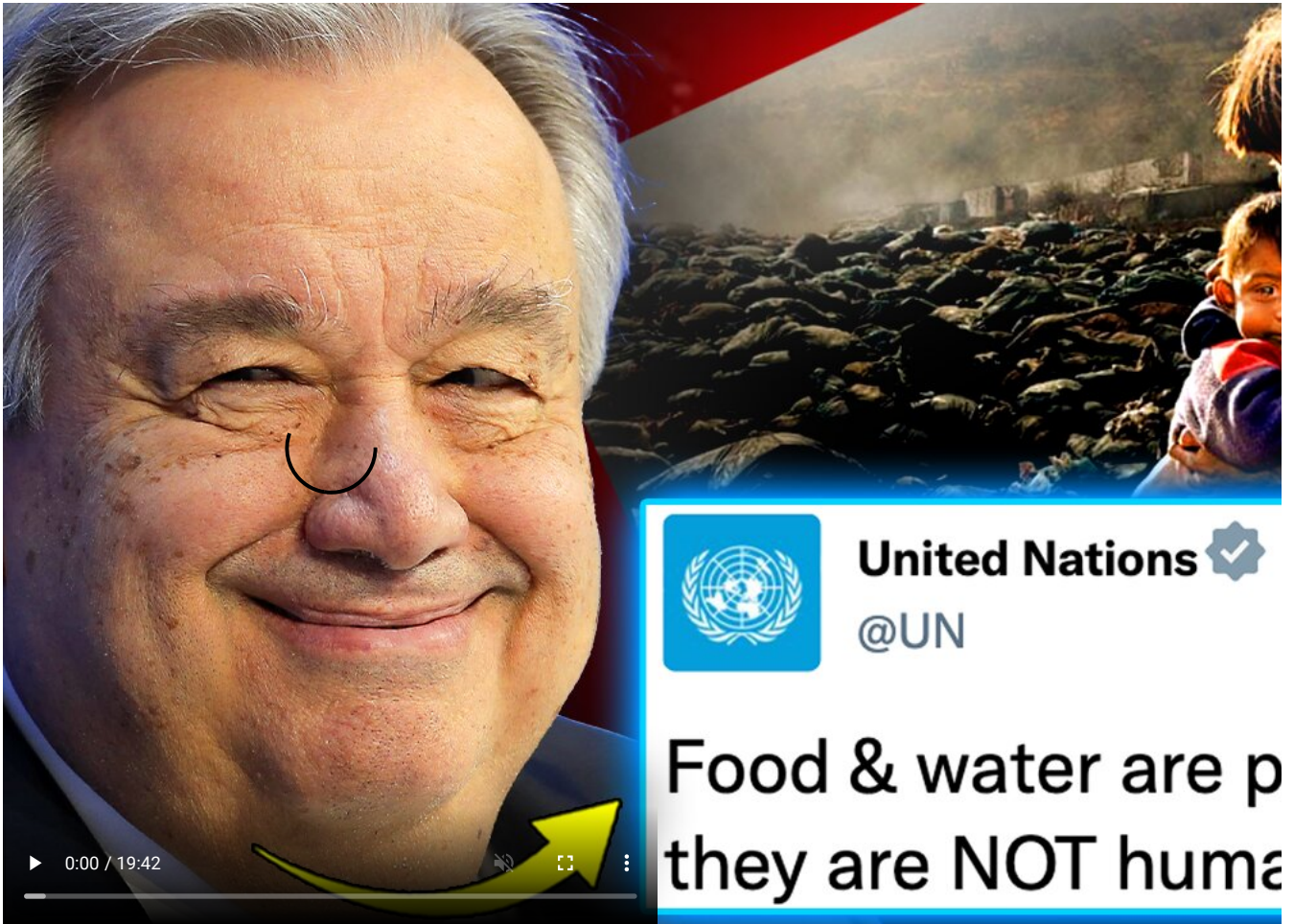
Leaked UN Footage Confirms Plans for Manufactured Global Famine in 2025